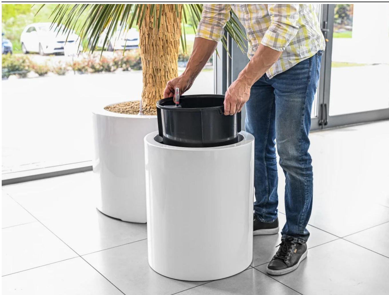
Okrągły wkład do donicy SWIP 38x38 cm - usadowienie w donicy D901N

Aby ukryć wkład w donicy i uzyskać estetyczny wygląd, polecamy użyć keramzytu do wypełnienia przestrzeni między wkładem a wnętrzem donicy.