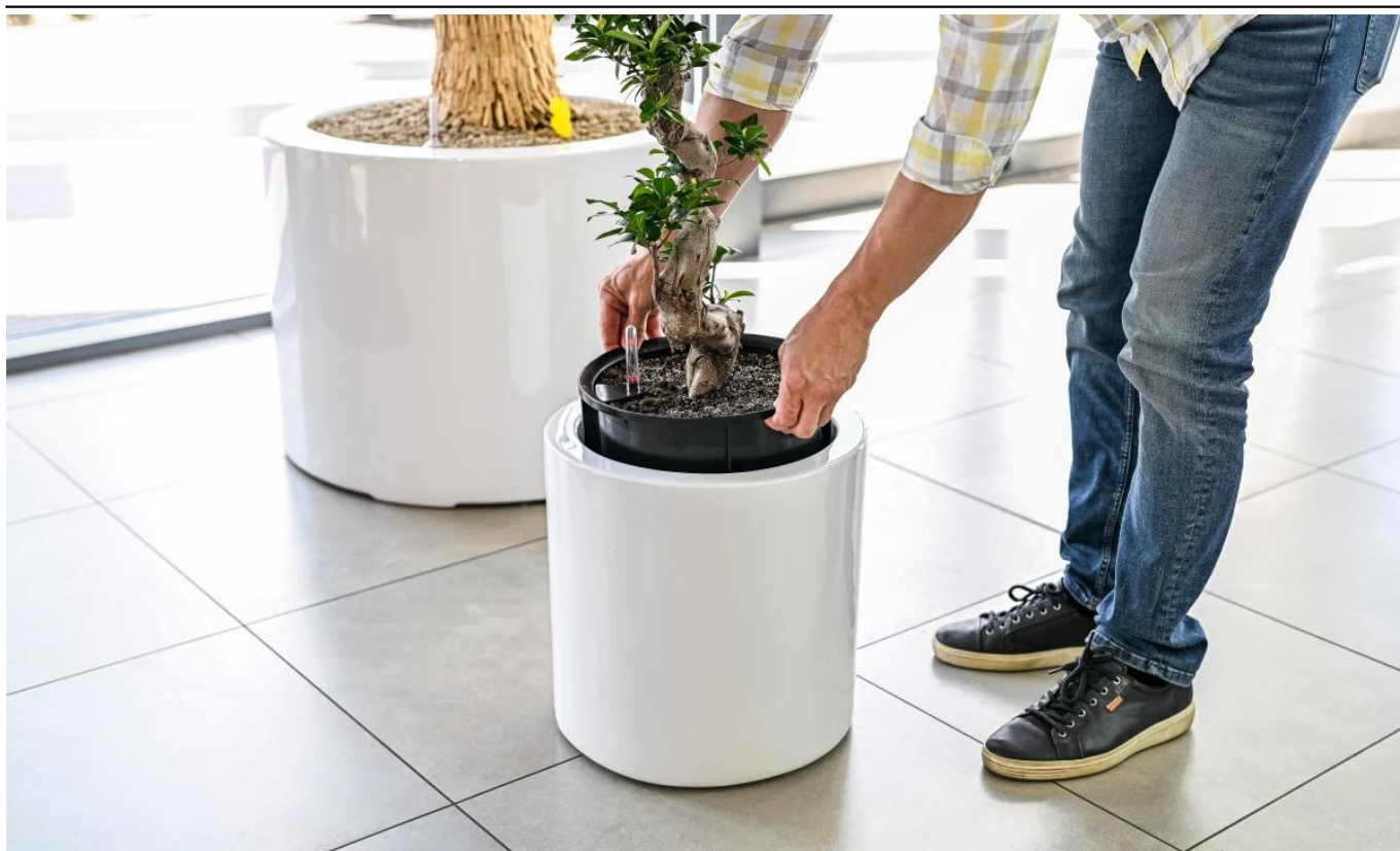
Okrągły wkład do donicy SWIP 31x33 cm - usadowienie w donicy D901B

Aby ukryć wkład w donicy i uzyskać estetyczny wygląd, polecamy użyć keramzytu do wypełnienia przestrzeni między wkładem a wnętrzem donicy.