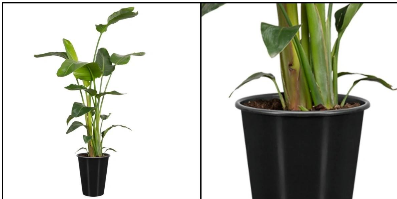
Okrągły wkład do donicy Ø29x35 cm

Zalecamy wykorzystanie tego okrągłego wkładu jako głównego pojemnika dla rośliny i umieszczenie go wewnątrz większej donicy, która w tym przypadku będzie pełniła rolę osłony. W przypadku doniczek wyposażonych w wewnętrzną półkę, a także w sytuacji braku półki w donicy, może być konieczne podniesienie wkładu na odpowiednią wysokość. Do tego celu świetnie nadaje się styropian lub keramzyt.