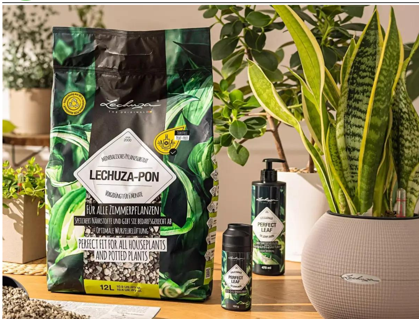
Lechuza Pon, nawozy Lechuza Perfect Leaf

Składniki: kruszywa mineralne (pumeks, lawa), zeolit, nawóz o przedłużonym działaniu.