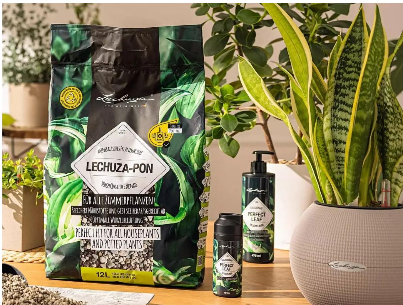
Lechuza Pon, nawozy Lechuza Perfect Leaf