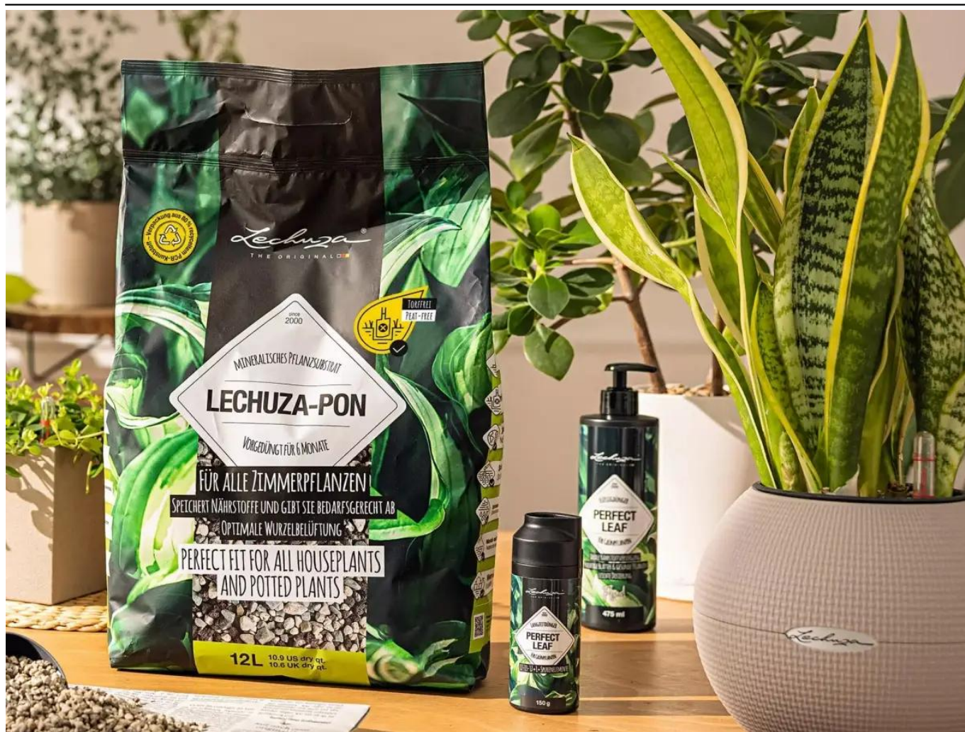
Lechuza Pon, nawozy Lechuza Perfect Leaf

Składniki: kruszywa mineralne (pumeks, lawa), zeolit, nawóz o przedłużonym działaniu.