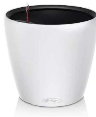
Wymiary doniczki Lechuza Classico Color LS 21