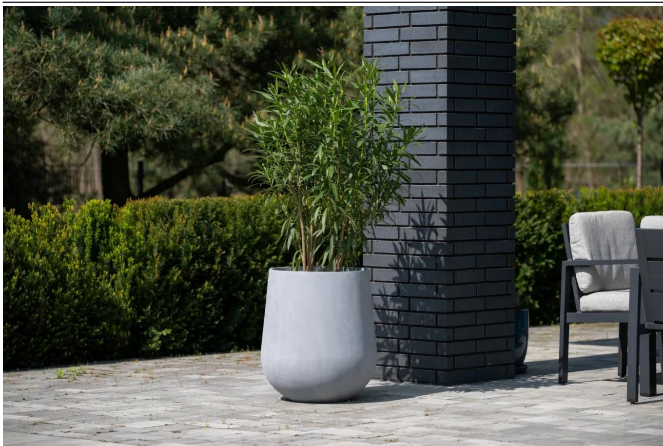
Oleander w donicy ZADORA Classic SQ65 Ø57x65 cm

BARTPOL Sp. z o.o. ul. Strzeszyńska 33 60-479 Poznań NIP: 6932050703 t. 61 661 61 78 t. 607 531 181