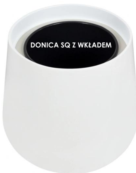
Donica SQ bez wkładu | Donica SQ z wkładem

Donice SQ65 oferują dwie warianty: pełnej objętości oraz z wymiowanym wewnętrznym wkładem . Wybór między