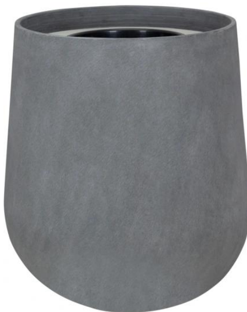
Wymiary donicy SQ65 szary beton - wersja z wewnętrznym wkładem

Wewnętrzny wymiowany 13 litrowy wkład jest dostępny jako opcja dla donicy SQ65.