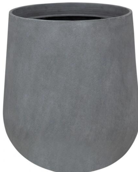
Wymiary donicy SQ65 szary beton - wersja bez wewnętrznego wkładu

Donica SQ65 dostępna jest również w opcji z wewnętrznym wkładem o pojemności 13 litrów.