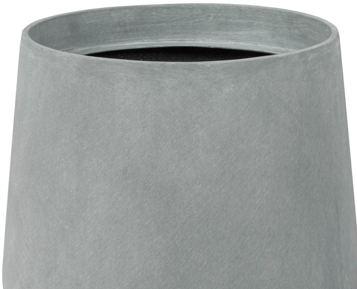
Powierzchnia donicy SQ65 w kolorze szary beton przypomina beton architektoniczny.

Szarobetonowa donica tarasowa SQ65 ma 57 cm średnicy i 65 cm wysokości.