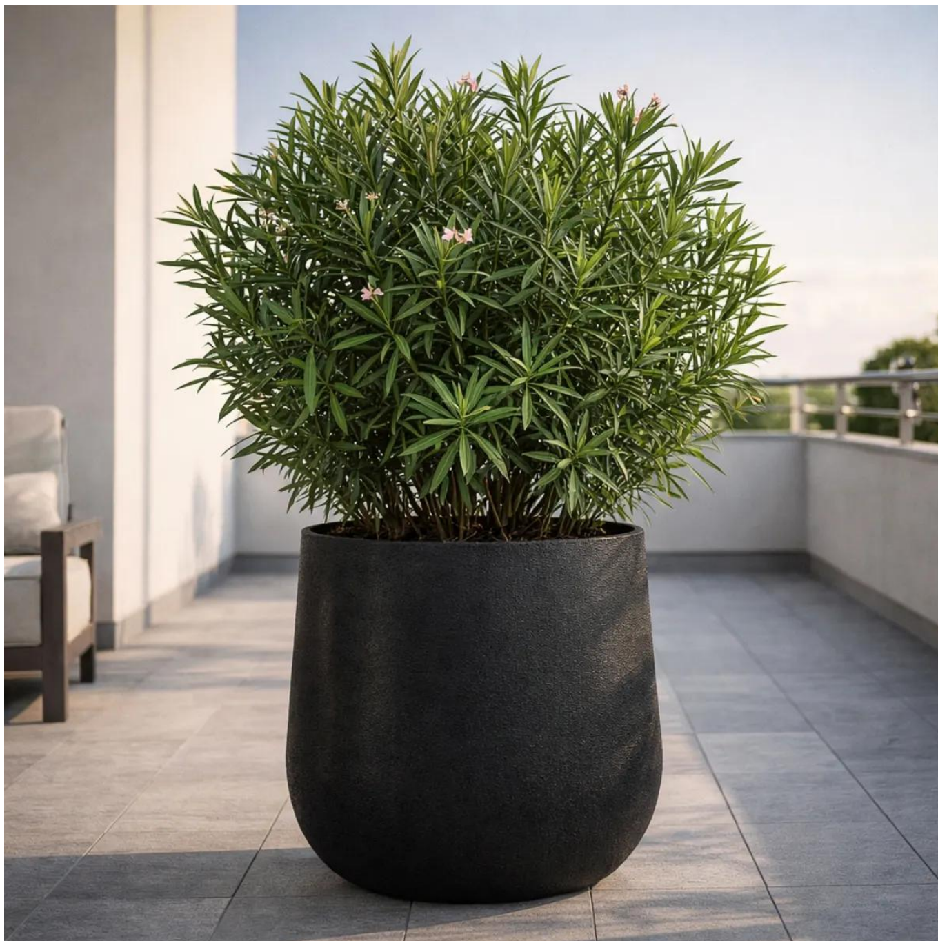
Duża donica czarny piaskowiec SQ65 bØ57x65 cm

Duża donica SQ65 Ø57x65 cm - idealna dla dużych roślin i nowoczesnych aranżacji.