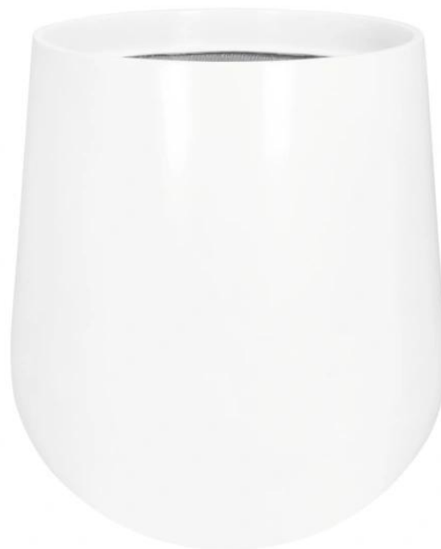
Wymiary donicy SQ65 biały mat - wersja bez wewnętrznego wkładu

Biała matowa donica SQ65 dostępna jest również w opcji z wymiowanym wewnętrznym wkładem o pojemności 13 litrów.