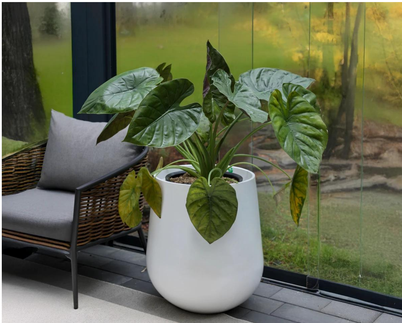
Duża biała matowa donica SQ65 bØ57x65 cm

Donica tarasowa SQ65 w kolorze biały mat ma 57 cm średnicy, 65 cm wysokości i 108 litrów pojemności.