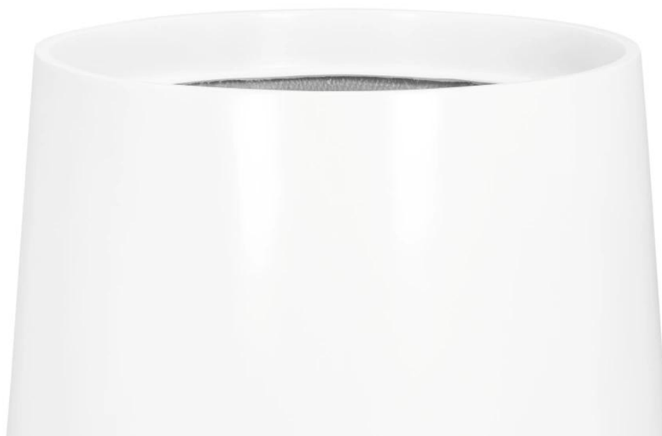
Gładka powierzchnia donicy SQ65 w kolorze biały mat

Nowoczesny, obły kształt donicy i satynowy biały odcień tworzą połączenie idealnie wpasowujące się w współczesne, minimalistyczne trendy aranżacyjne zarówno wewnątrz, jak i przestrzeni wypoczynkowych na tarasie czy balkonie. Dzięki odporności na warunki atmosferyczne oraz pełnej mrozoodporności, donica SQ65 umożliwia kreowanie zielonych dekoracji przez cały rok na tarasie i balkonie.