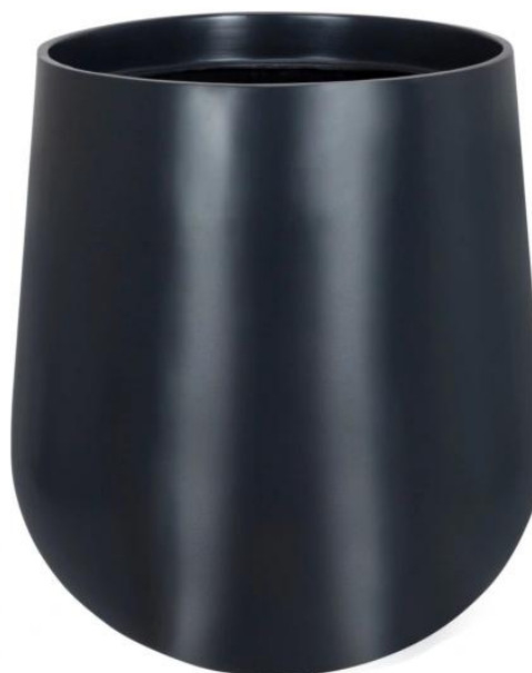
Wymiary donicy SQ65 antracyt mat - wersja bez wewnętrznego wkładu

Wymowany wkład o pojemności 13 litrów to opcja dodatkowa do donicy SQ65.