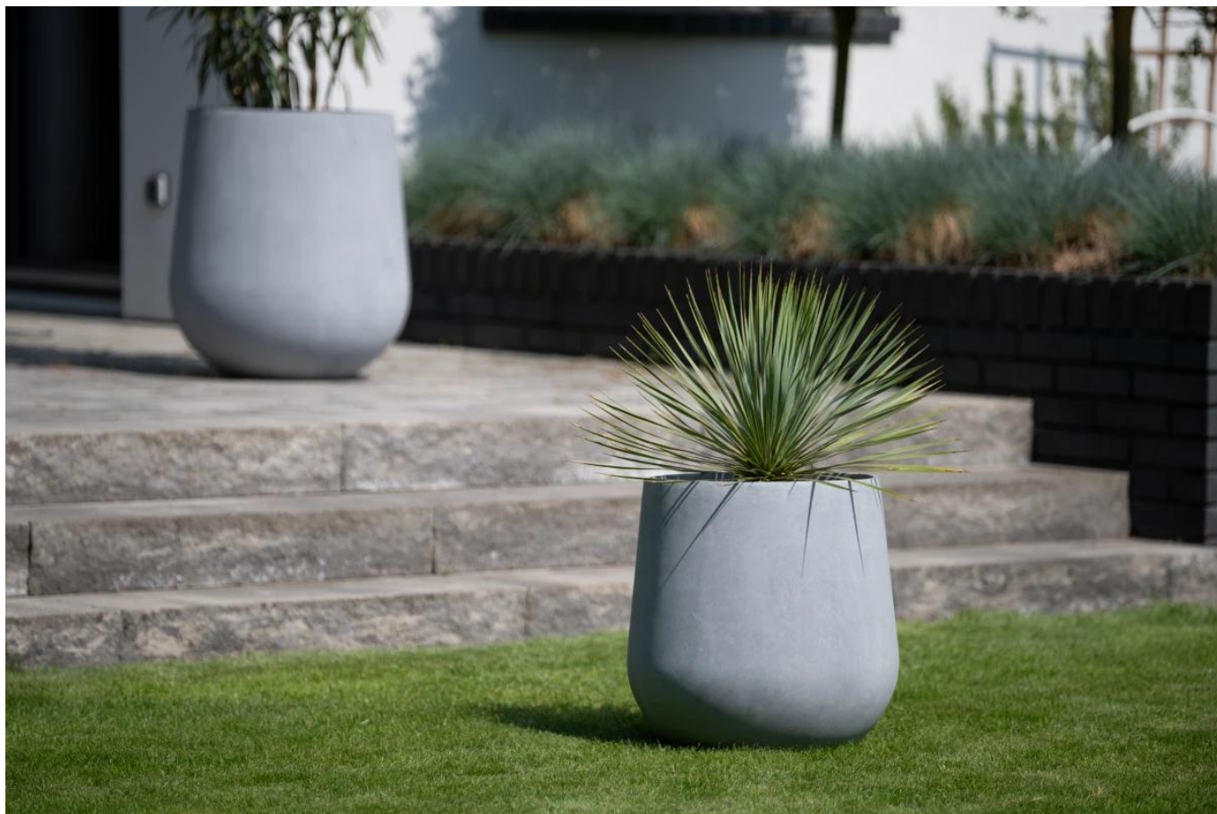
Okrągła donica ogrodowa SQ50 Ø48x50 cm szary beton

Wkład o pojemności 17 litrów z systemem nawadniania - opcja dodatkowa do donicy SQ50.