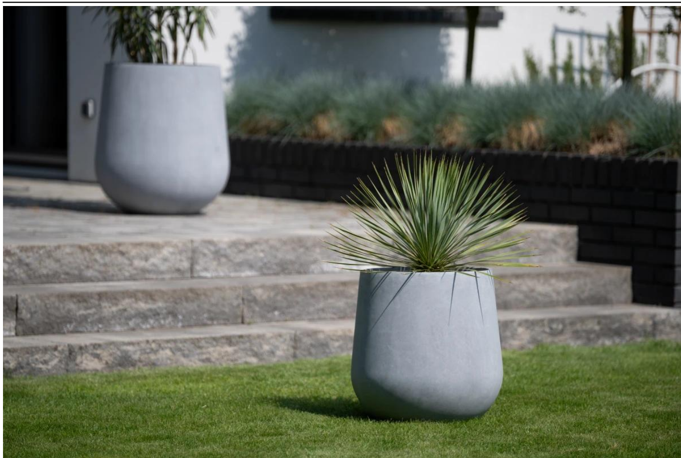
Okrągła donica ogrodowa SQ50 Ø48x50 cm szary beton

BARTPOL Sp. z o.o. ul. Strzeszyńska 33 60-479 Poznań NIP: 6932050703 t. 61 661 61 78 t. 607 531 181