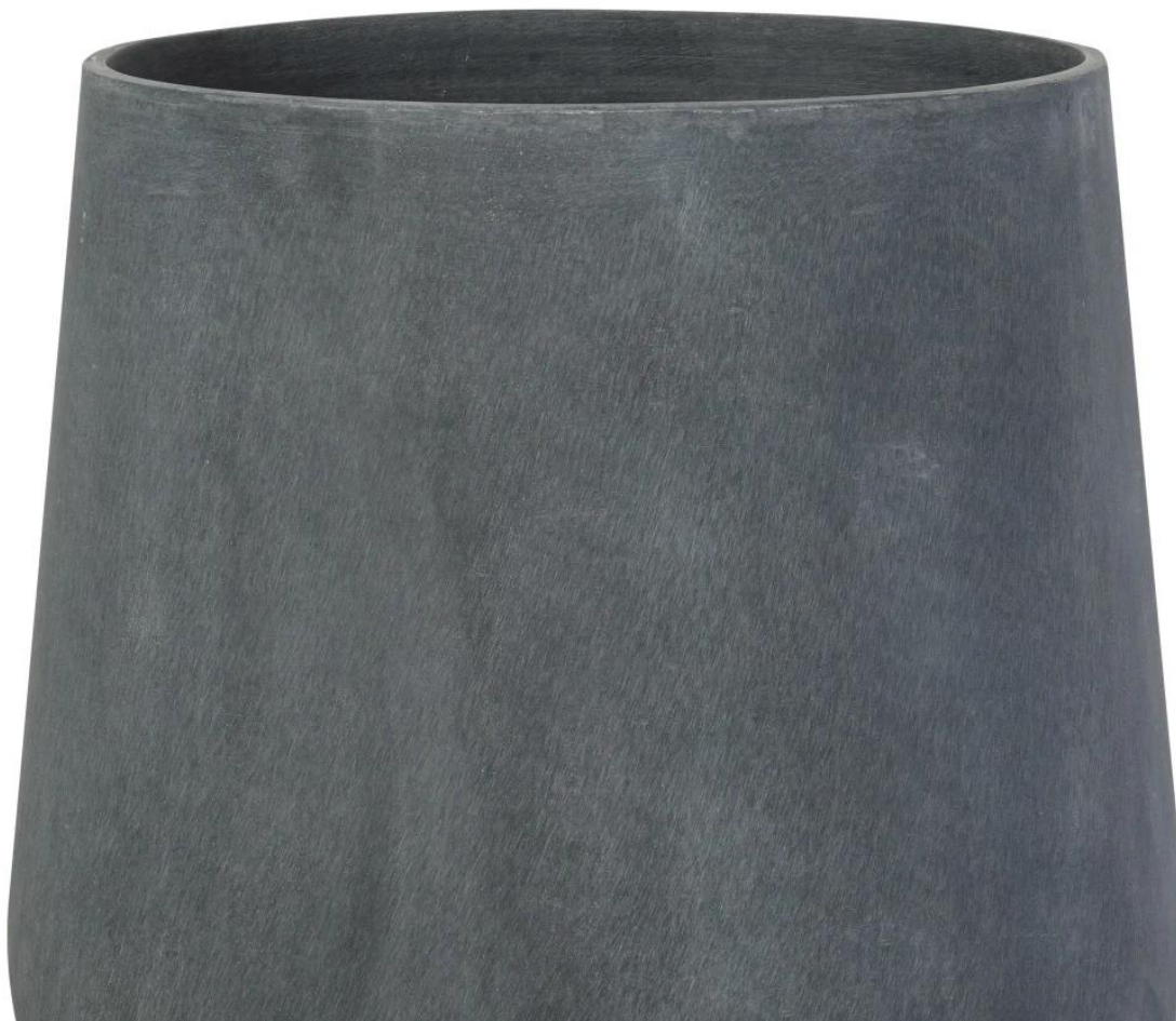
Powierzchnia donicy SQ50 w kolorze grafitowy beton przypomina beton architektoniczny.