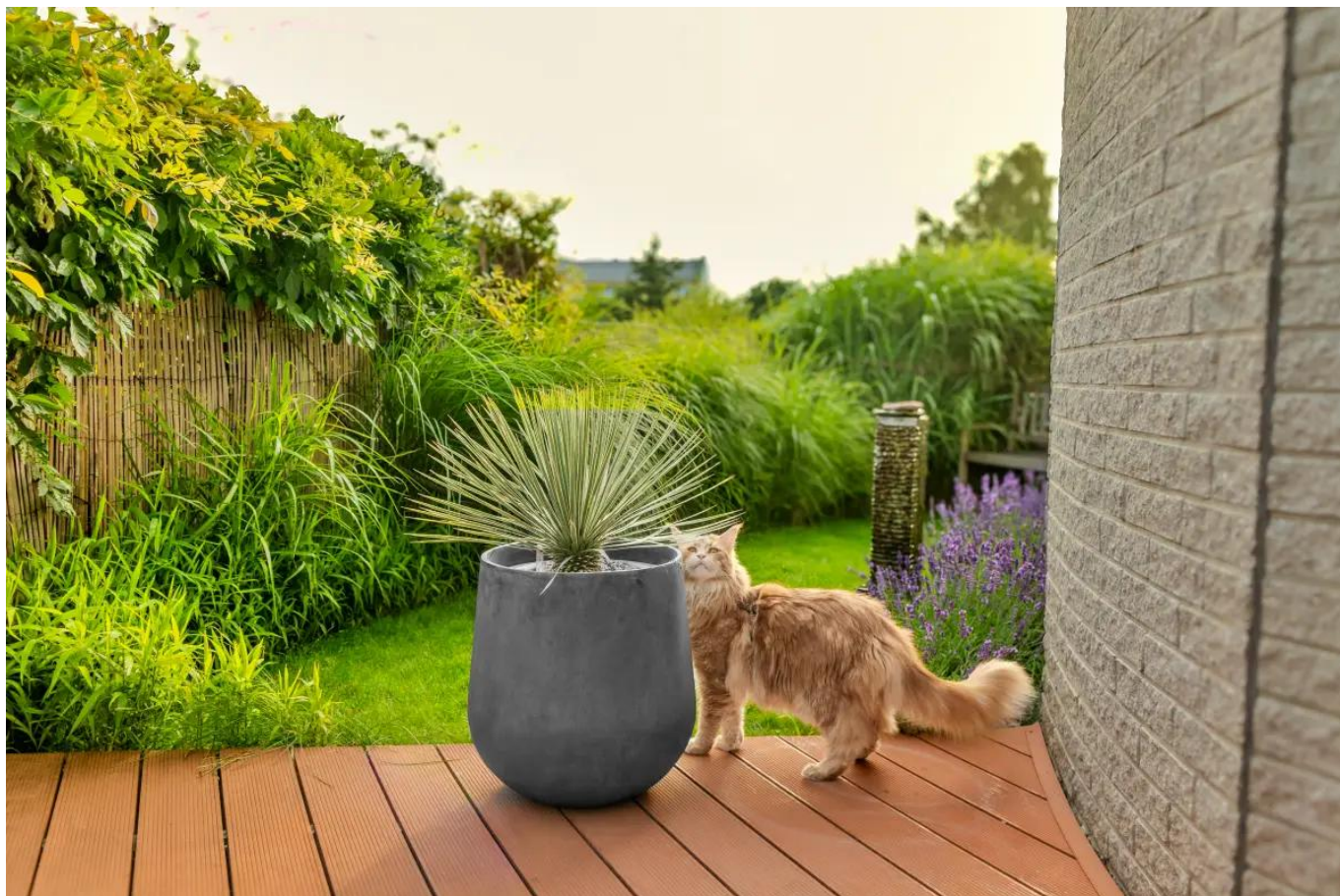
Okrągła donica tarasowa SQ50 grafitowy beton