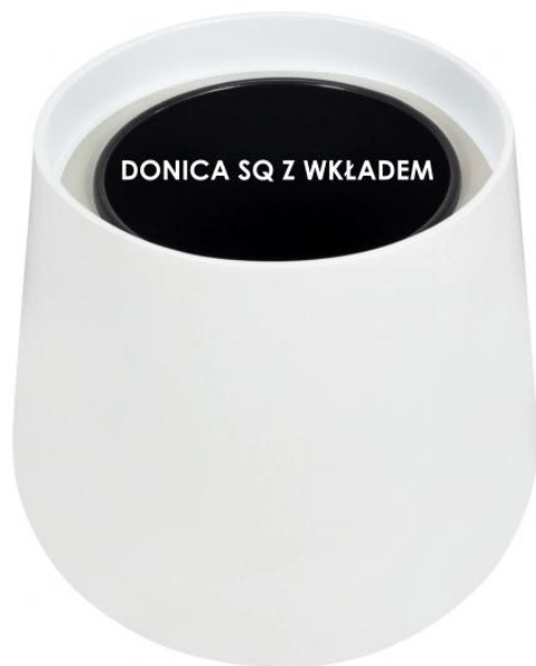
Donica SQ bez wkładu | Donica SQ z wkładem