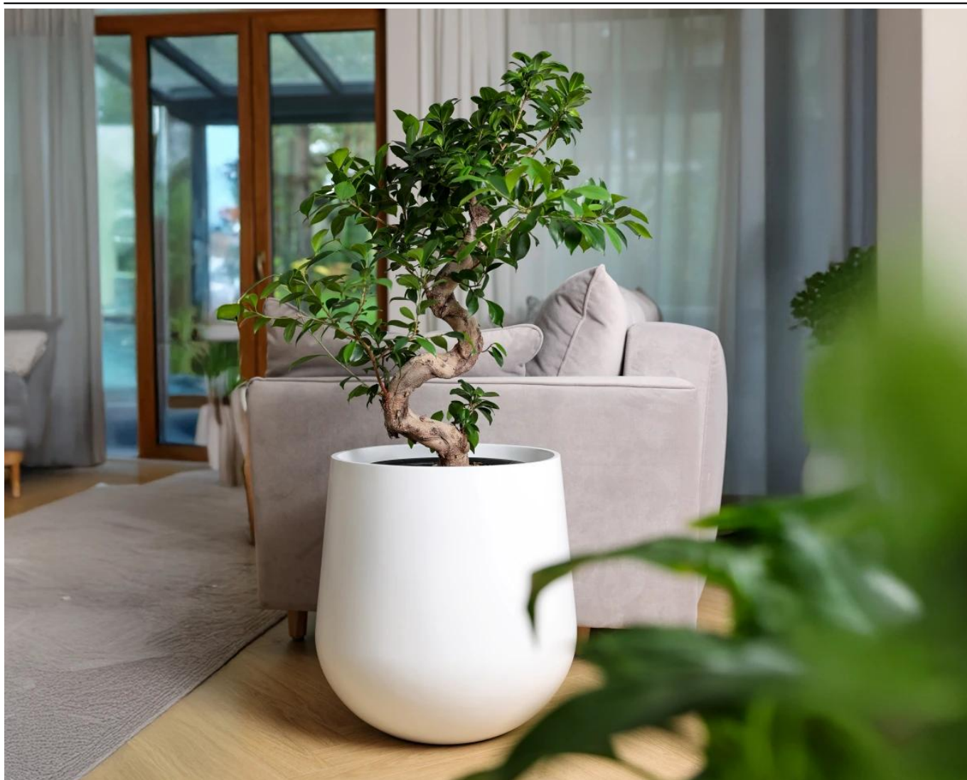
Donica ZADORA Classic SQ50 biały mat

BARTPOL Sp. z o.o. ul. Strzeszyńska 33 60-479 Poznań NIP: 6932050703 t. 61 661 61 78 t. 607 531 181