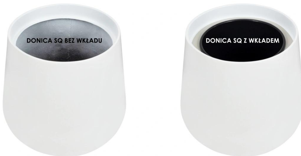
Donica SQ bez wkładu | Donica SQ z wkładem

Opcjonalny wymiowy wkład sprawia, że Twoja nowa donica SQ50 zaskoczy cię swoją uniwersalnością. Wersja o pełnej objętości (bez wkładu) będzie doskonała jako donica ogrodowa, donica na taras lub donica dla dużych roślin domowych. Wersja z wewnętrznym wkładem sprawdzi się jako donica do domu, donica do biura lub donica na sezonowe dekoracje z roślin kwitnących. Wiele zastosowań donicy SQ50 zależy tylko od Twojej pomysłowości.