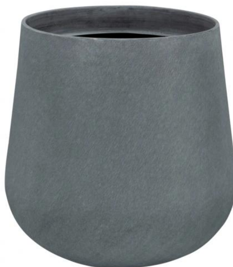
Doniczka SQ40 szary beton - wersja bez wewnętrznego wkładu

Donica SQ40 dostępna jest również w opcji z wewnętrznym wkładem o pojemności 10 litrów.