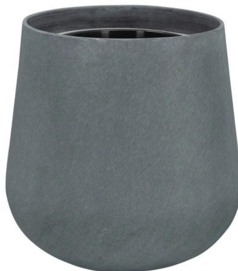
Doniczka SQ40 szary beton - wersja z wewnętrznym wkładem

Wewnętrzny wymowany 10 litrowy wkład jest dostępny jako opcja dla donicy SQ40.