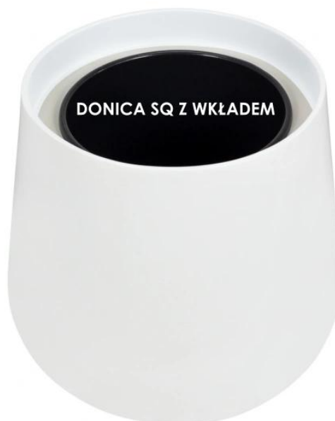
Donica SQ bez wkładu | Donica SQ z wkładem

Donice SQ40 są dostępne w dwóch wersjach: o pełnej objętości i z wewnętrznym wymowanym wkładem . Wybór między wariantem z wewnętrznym wkładem a bez niego otwiera przed nami szeroki zakres możliwości dostosowania do naszych indywidualnych potrzeb i gustów dekoracyjnych. To umożliwia niezwykle łatwe dopasowanie donic do naszych