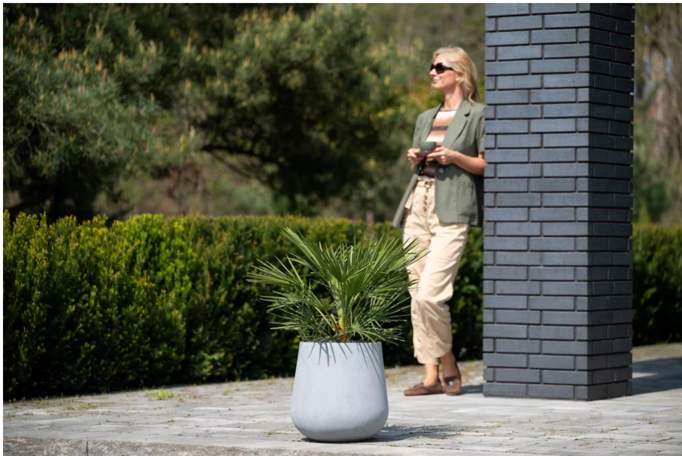
Palma karłatka w donicy SQ40 Ø40x40 cm szary beton

Doniczka SQ40 bez wewnętrznego wkładu to średniej wielkości donica o wysokości 40 cm i średnicy 40 cm, i pojemności wynoszącej około 40 litrów . Takie rozmiary donicy pozwalają na wykorzystanie jej zarówno na zewnątrz jako donicy tarasowej , jak i donicy dla sporych roślin ozdobnych przeznaczonych do uprawy w domu lub biurze. Należy jednak pamiętać o tym, że donica przeznaczona na taras lub balkon, powinna posiadać otwory odpływowe w dnie. Wykonanie ich jest proste i można to zrobić samodzielnie przy użyciu wiertarki i wiertła o średnicy 10-12mm.