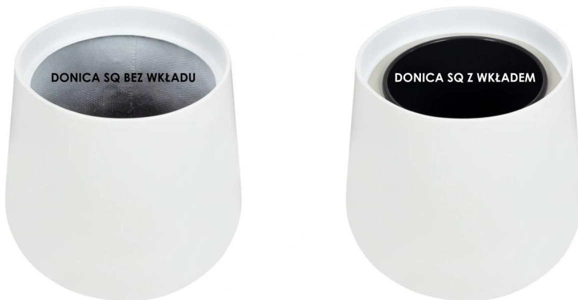
Donica SQ bez wkładu | Donica SQ z wkładem

Donica SQ40 oferuje wiele możliwości, szczególnie za sprawą wyjmowanego wewnętrznego wkładu o pojemności 10 litrów . Ten opcjonalny dodatek istotnie wzbogaca funkcjonalność donicy oraz ułatwia pielęgnację roślin. Dzięki temu rozwiązaniu, mamy teraz możliwość wygodnej i elastycznej wymiany roślin , co umożliwia tworzenie zmieniających się aranżacji wewnątrz zgodnie z naszymi preferencjami. To daje nam swobodę do eksperymentowania i dostosowywania przestrzeni według własnych upodobań i pozwala na stworzenie unikalnych kompozycji roślinnych.