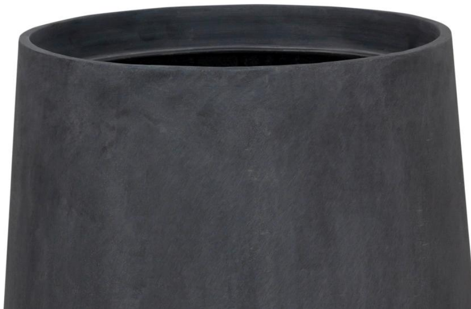
Wykończenie powierzchni doniczki SQ40 przypomina grafitowy beton architektoniczny

Doniczka ma zaokrąglony kształt oraz minimalistyczne, surowe wykończenie nawiązujące do charakterystycznego wyglądu betonu architektonicznego . Stanowi idealne uzupełnienie nowoczesnych trendów wystroju, zarówno w przestrzeniach mieszkalnych, jak i biurowych. Dzięki swojej wytrzymałości na działanie czynników atmosferycznych, doniczka SQ40 w antracytowym odcieniu betonu doskonale sprawdzi się również jako dekoracja na balkonach oraz tarasach.