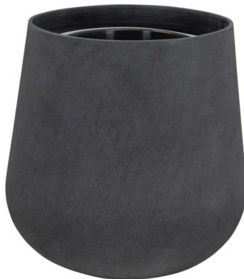
Doniczka SQ40 grafitowy beton - wersja z wewnętrznym wkładem

Wewnętrzny wymiowany 10 litrowy wkład to opcja dodatkowa dla donicy SQ40.