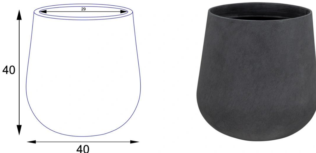
Doniczka SQ40 grafitowy beton - wersja bez wewnętrznego wkładu

Nasypanie warstwy drenażowej z keramzytu jest również wskazane w przypadku doniczek umieszczanych na zewnątrz, na tarasach czy balkonach. Dzięki swojej charakterystyce, keramzyt absorbuje znaczną ilość wody, a następnie stopniowo uwalnia ją do gleby, stwarzając optymalne warunki wzrostu dla roślin.