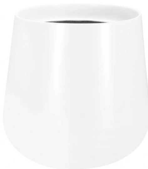
Doniczka SQ40 biały mat - wersja bez wewnętrznego wkładu

Wymowany wkład o pojemności 10 litrów - wewnętrzna donica, to opcjonalne wyposażenie do modelu SQ40.