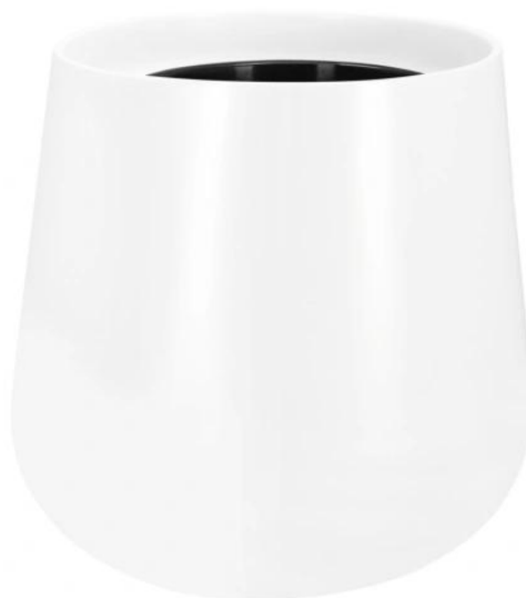
Doniczka SQ40 biały mat - wersja z wewnętrznym wkładem

Opcjonalny wymowalny wewnętrzny wkład Ø26x25 cm to idealne rozwiązanie dla roślin pokojowych.