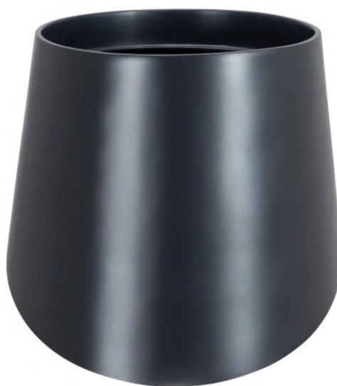
Doniczka SQ40 antracyt mat - wersja bez wewnętrznego wkładu

Donicę SQ40 możesz zakupić w opcji z wyjmowaną wewnętrzną doniczką o pojemności 10 litrów.