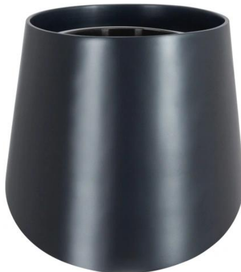
Doniczka SQ40 antracyt mat - wersja z wewnętrznym wkładem

Wewnętrzna wyjmowana donica o pojemności 10 litrów to opcja dodatkowa dla donicy SQ40.