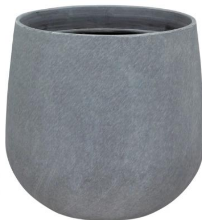
Wymiary doniczki SQ30 w kolorze szary beton

Lekka, trwała i odporna na uszkodzenia - doskonała do mniejszych roślin ozdobnych.