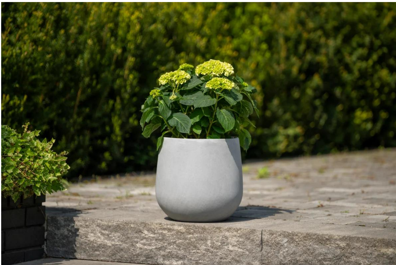
Hortensja w donicy SQ30 w kolorze szary beton

Planując wykorzystanie doniczki SQ30 na tarasie lub balkonie, pamiętaj aby wykonać w jej dnie otwory odpływowe , dzięki którym nie będzie się w niej gromadzić woda z opadów. Dzięki tym otworom doniczka SQ30 będzie również całkowicie odporna na mróz i bez obaw o jej zniszczenie, będzie mogła pełnić swoją dekoracyjną rolę na tarasie lub balkonie przez cały rok. Otwory bez trudu można wykonać samodzielnie przy użyciu wiertarki i wiertła o średnicy 10-12 mm. Poza wykonaniem otworów, zalecamy wsypanie na dno doniczki kilkucentymetrowej warstwy keramzytu. To kruszywo ceramiczne ma bardzo porowatą strukturę, która wchłania duże ilości wody, a następnie stopniowo uwalnia wilgoć do podłoża.