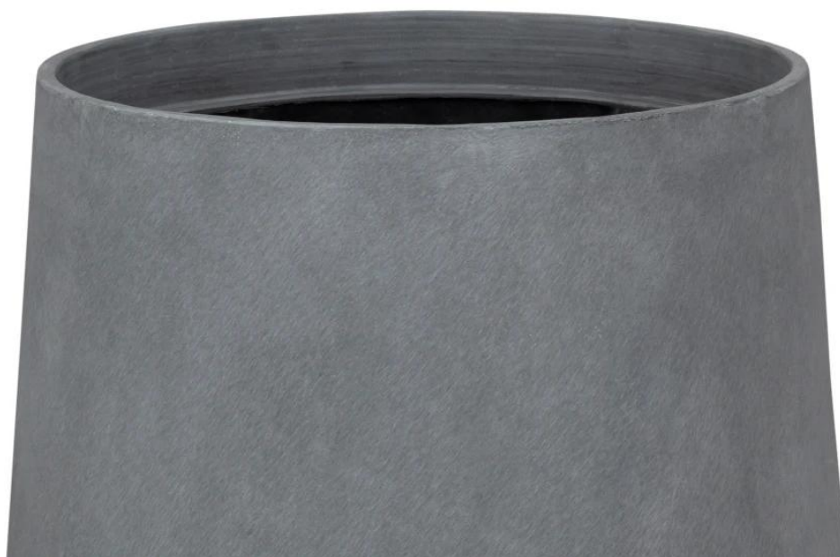
Wykończenie powierzchni doniczki SQ30 przypomina szary beton architektoniczny

Doniczka ZADORA Classic SQ30 w kolorze szarego betonu , wyprodukowana została z kompozytu włókna szklanego, żywicy poliestrowej i cementu. To unikalne połączenie materiałów sprawia, że doniczka jest bardzo lekka, odporna na warunki atmosferyczne i w 100% mrozoodporna. Szara wyglądająca jak betonowa powierzchnia doniczki posiada delikatną fakturę powierzchni doskonale imitująca beton architektoniczny. Obły kształt doniczki i minimalistyczne surowe betonowe wykończenie idealnie wpisują się we współczesne trendy wyposażania wnętrz mieszkalnych i biurowych. Odporność na działania czynników atmosferyczny pozwala również na wykorzystanie szarobetonowej doniczki SQ30 do dekoracji na balkonach i tarasach.