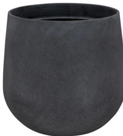
Wymiary doniczki SQ30 w kolorze grafitowy beton

Doniczka SQ30 grafitowy beton jest niezwykle lekka, trwała i odporna na uszkodzenia - idealna jako doniczka na balkon lub taras.