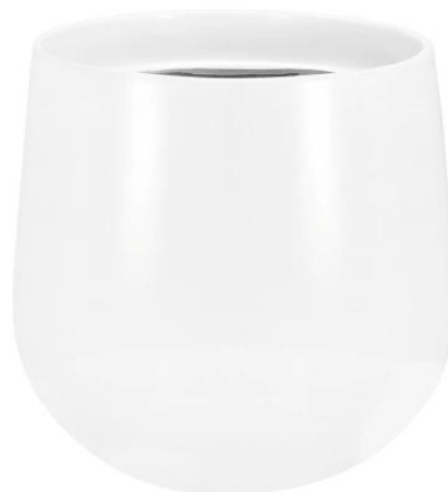
Wymiary doniczki SQ30 w kolorze biały mat

Doniczka SQ30 biały mat jest lekka i elegancka - doskonała do salonu lub biura.