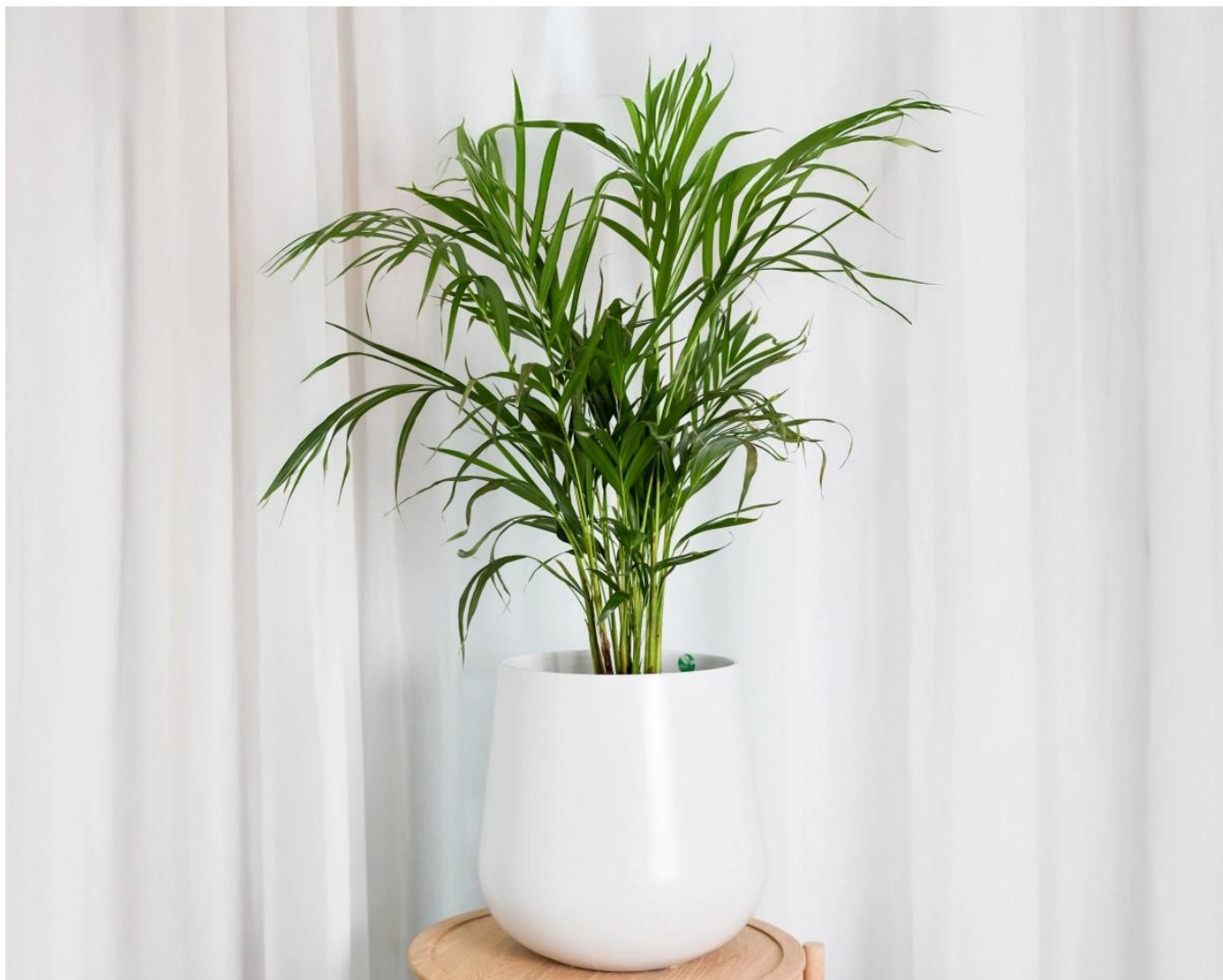
Biała matowa doniczka SQ30 Ø32x30 cm

Doniczka SQ30 biały mat ma 32 cm średnicy i 30 cm wysokości.