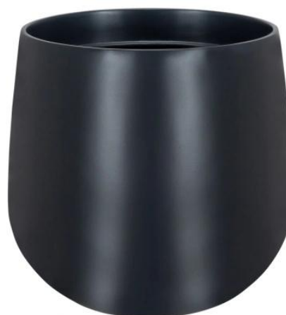
Wymiary doniczki SQ30 w kolorze antracyt mat

Doniczka SQ30 antracyt mat jest lekka, odporna na uszkodzenia i w 100% mrozoodporna - idealna jako doniczka na balkon lub taras.