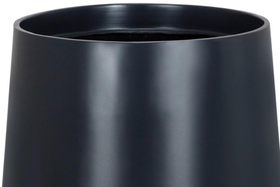
Gładka powierzchnia doniczki SQ30 w kolorze antracyt mat

Dzięki wyjątkowej wytrzymałości na działanie czynników atmosferycznych, grafitowa doniczka SQ30 staje się doskonałym elementem dekoracyjnym zarówno na balkonach, jak i tarasach.