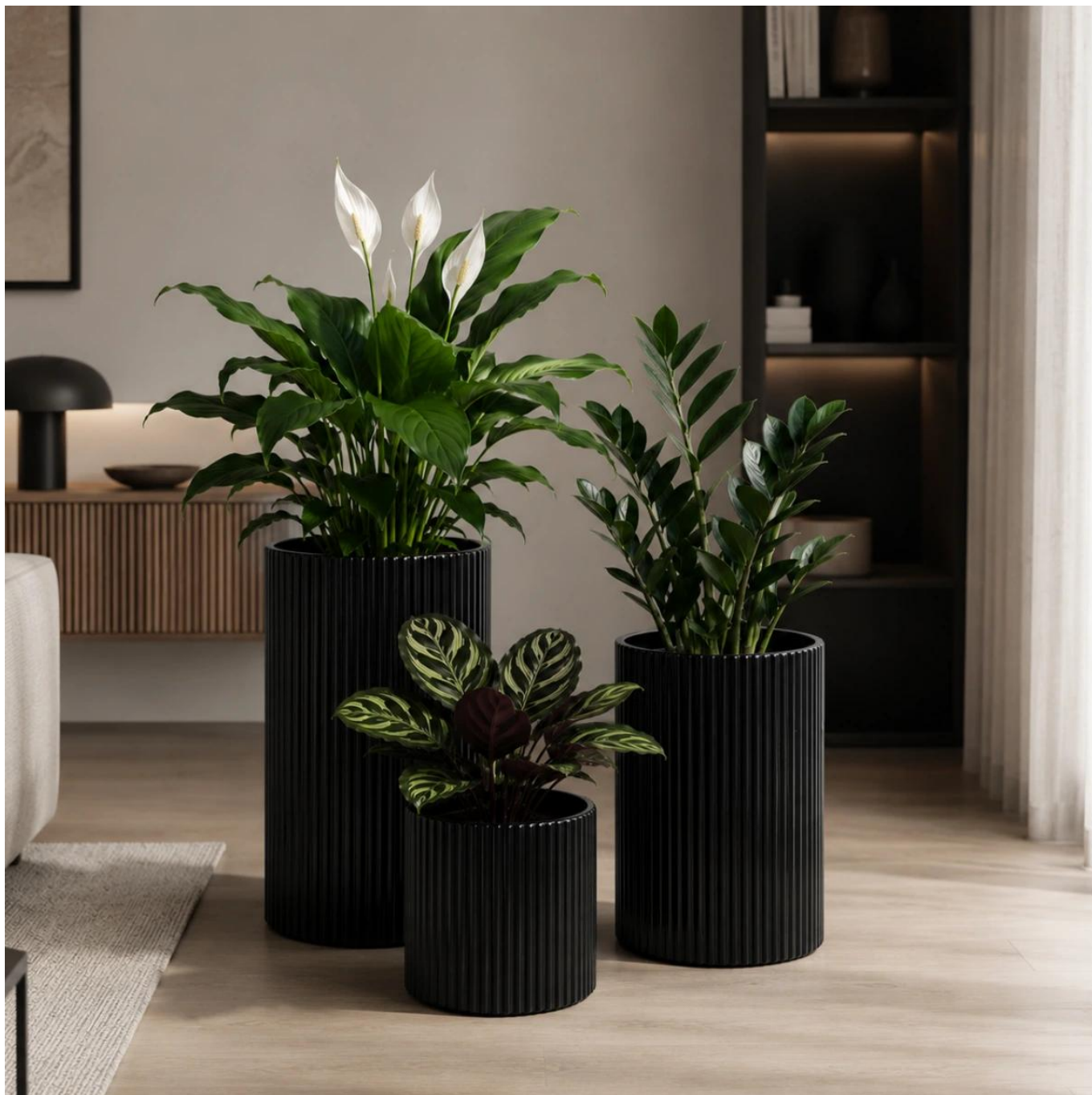
Ryflowana faktura powierzchni donic ZADORA Classic RC 50, 65 i 80 cm