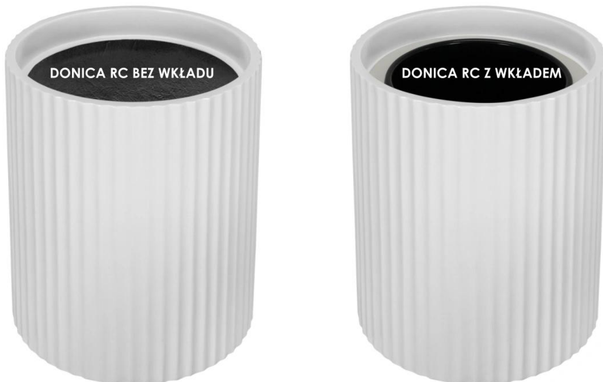
Donica RC bez wkładu | Donica RC z wkładem

BARTPOL Sp. z o.o. ul. Głogowska 218 60-104 Poznań NIP: 6932050703 t. 61 661 61 78 t. 607 531 181