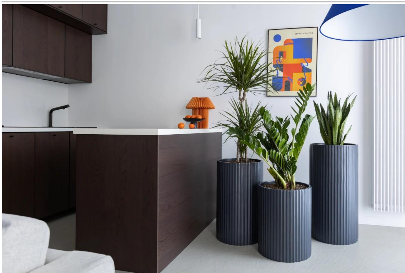
Ryflowana faktura powierzchni donic ZADORA Classic RC 50, 65 i 80 cm

BARTPOL Sp. z o.o. ul. Głogowska 218 60-104 Poznań NIP: 6932050703 t. 61 661 61 78 t. 607 531 181