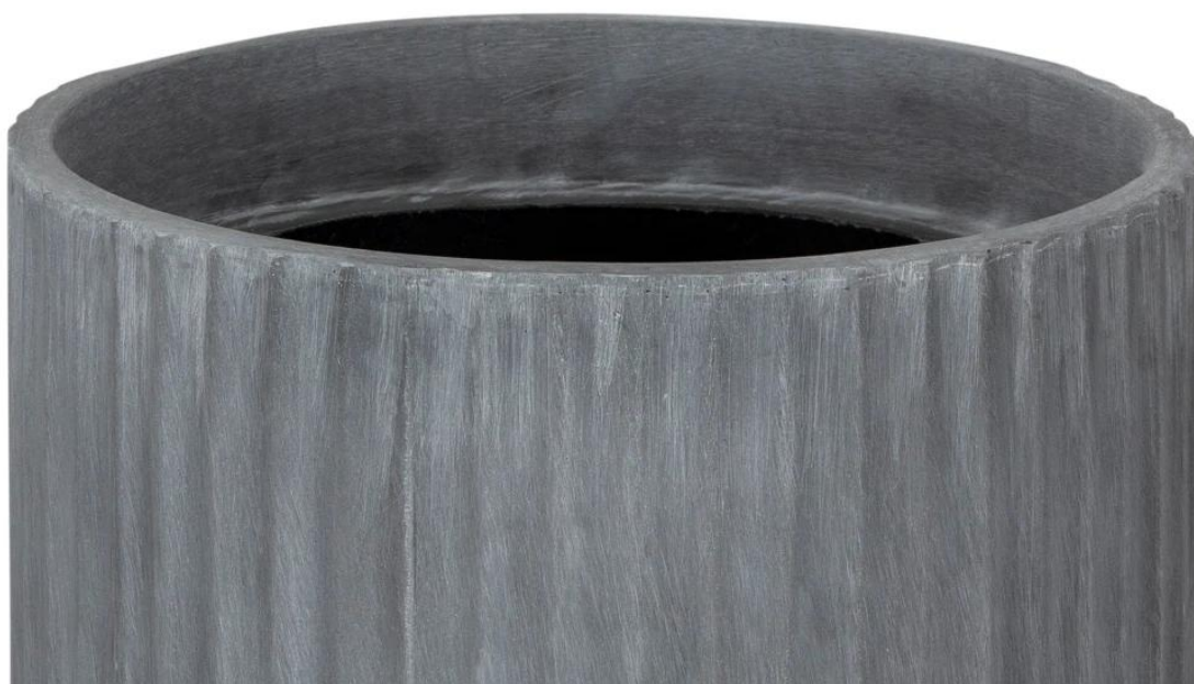
Ryflowana faktura powierzchni doniczki RC65 w kolorze szarego betonu

Donica RC65, w odcieniu szarego betonu , wyprodukowano z kompozytu laminatu włókna szklanego, żywicy poliestrowej i cementu. To wyjątkowe połączenie gwarantuje efekt betonu architektonicznego przy zachowaniu niewielkiej wagi . Materiały i technologia zaczerpnięte z przemysłu jachtowego zapewniają trwałość i odporność na warunki atmosferyczne przez długie lata.