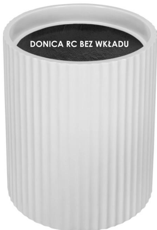
DONICA RC BEZ WKŁADU

BARTPOL Sp. z o.o. ul. Głogowska 218 60-104 Poznań NIP: 6932050703 t. 61 661 61 78 t. 607 531 181