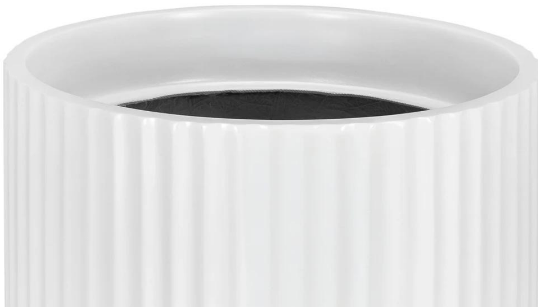
Ryflowana faktura powierzchni doniczki RC65 w kolorze biały mat

Matowa biała donica RC65 ma 40 cm średnicy i 65 cm wysokości.