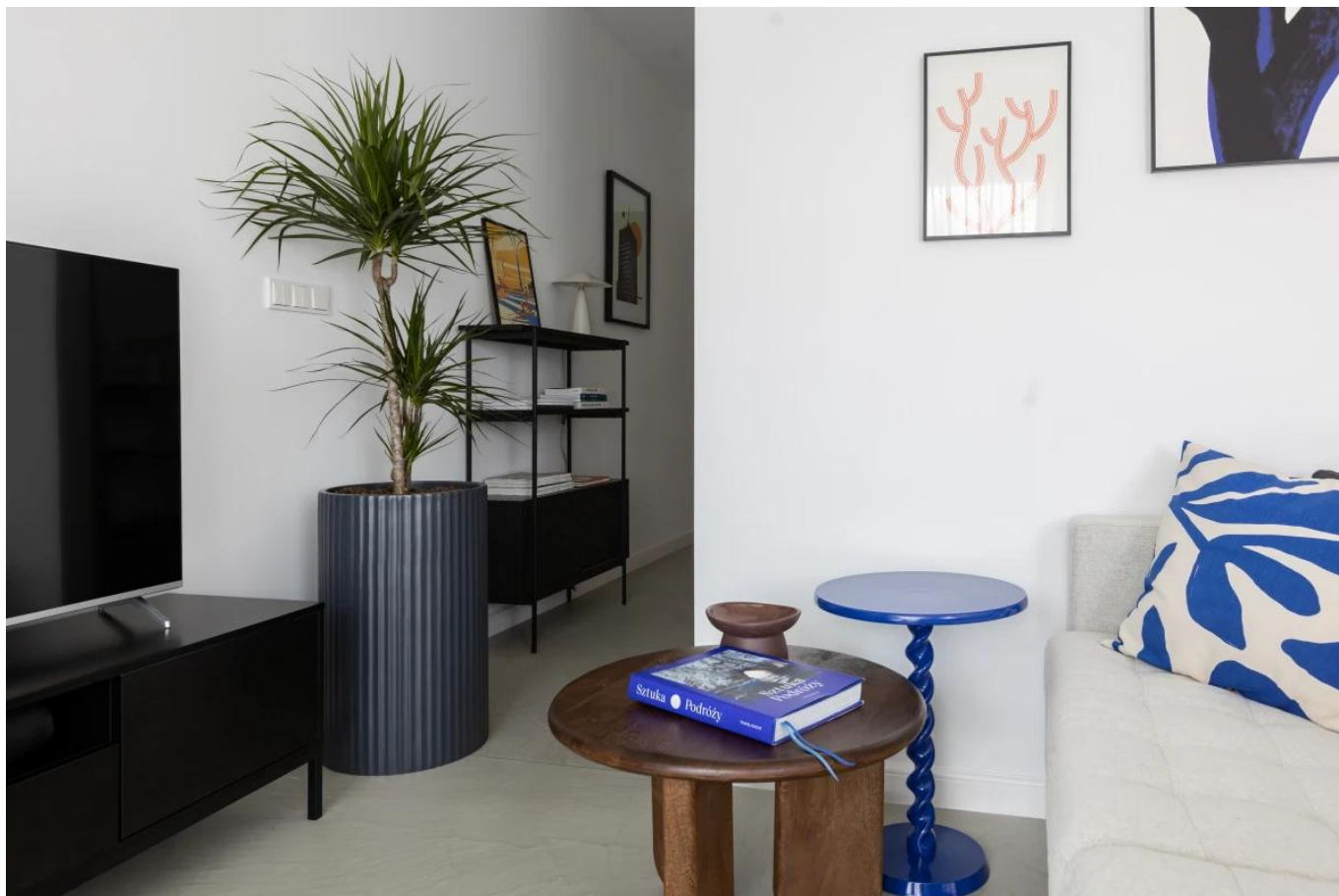
Dracena w antracytowej donicy ZADORA Classic RC65

Matowa antracytowa donica RC65 ma 40 cm średnicy i 65 cm wysokości.