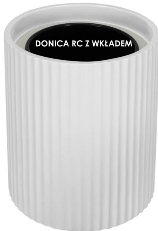
Donica RC bez wkładu | Donica RC z wkładem

Donice RC50 oferowane są w dwóch wariantach: jednym z pełną pojemnością i drugim z wymowanym wewnętrznym wkładem . Wybór pomiędzy opcją z wewnętrznym wkładem a bez niego otwiera przed nami szerokie spektrum dostosowania do naszych indywidualnych potrzeb oraz dekoracyjnych upodobań. To umożliwi nam wyjątkowo łatwe dopasowanie donic do naszych preferencji, jednocześnie tworząc wyjątkową atmosferę nasyconą urokiem roślin.