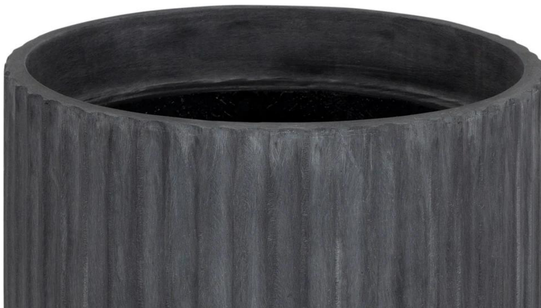
Ryflowana faktura powierzchni doniczki RC50 w kolorze grafitowego betonu

Ta wersja donicy RC50, utrzymana w tonacji grafitowego betonu, opiera się na konstrukcji z laminatu włókna szklanego i żywicy poliestrowej z dodatkiem cementu. To niezwykle połączenie kompozytu i cementu nadaje donicy wyjątkowy charakter betonu architektonicznego , zachowując jednocześnie lekkość i praktyczność. Dzięki zastosowaniu tych innowacyjnych materiałów oraz technologii inspirowanej przemysłem jachtowym, donica jest odporna na warunki atmosferyczne , co zapewnia jej trwałość na długie lata . To nie tylko funkcjonalny element, ale również artystyczny dodatek, który doskonale wkomponuje się w różnorodne przestrzenie.