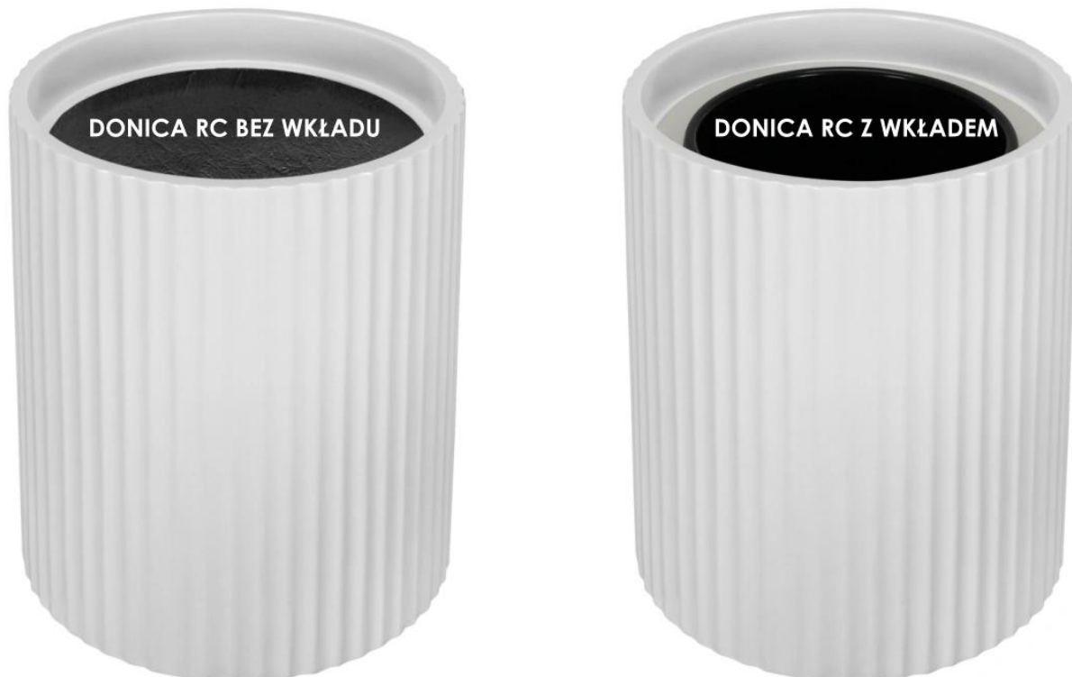
Donica RC bez wkładu | Donica RC z wkładem

Donice RC50 oferowane są w dwóch wariantach: jednym z pełną pojemnością i drugim z wyjmowanym wewnętrznym wkładem . Wybór pomiędzy opcją z wewnętrznym wkładem a bez niego otwiera przed nami szerokie spektrum dostosowania do naszych indywidualnych potrzeb oraz dekoracyjnych upodobań. To umożliwi nam wyjątkowo łatwe dopasowanie donic do naszych preferencji, jednocześnie tworząc wyjątkową atmosferę nasyconą urokiem roślin.