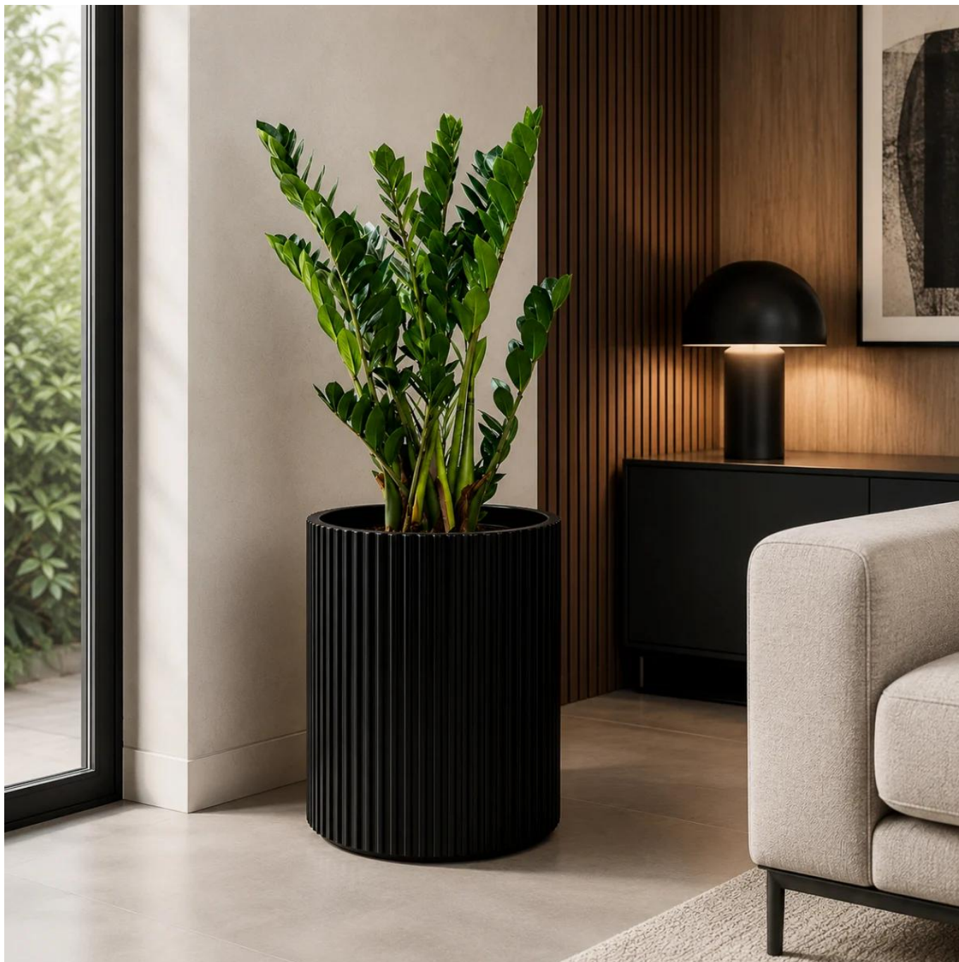
Donica z włókna szklanego RC50 czarny mat

Donica Ø40x50 cm do wnętrza, na balkon i nowoczesny taras.