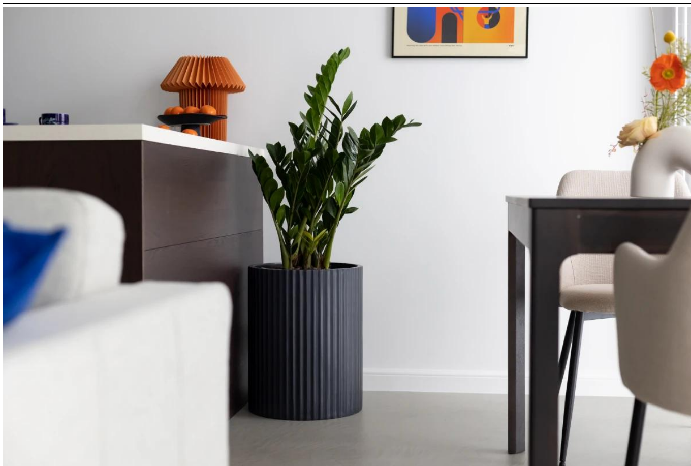
Donica ZADORA Classic RC50 w kolorze antracyt mat

BARTPOL Sp. z o.o. ul. Głogowska 218 60-104 Poznań NIP: 6932050703 t. 61 661 61 78 t. 607 531 181