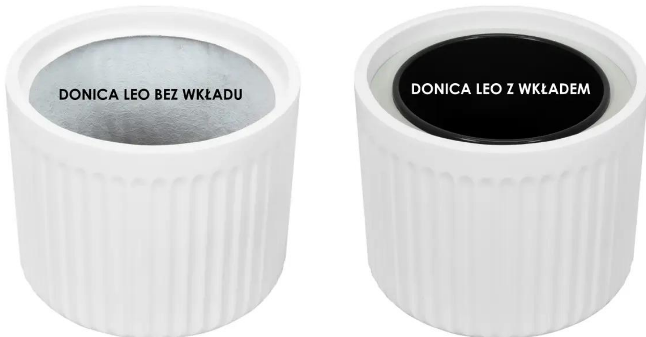
Donica LEO bez wkładu | Donica LEO z wkładem

Donica LEO37 oferuje dwie wyjątkowe opcje, gwarantujące wygodne dostosowanie do różnorodnych kontekstów. Niezależnie od tego, czy tworzysz zieloną kompozycję w swoim wnętrzu, biurze, na tarasie czy balkonie, donica LEO37 stanowi niezawodny i doskonale skrojony wybór.