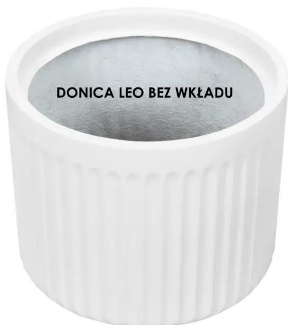
DONICA LEO BEZ WKŁADU

Donica LEO37 otwiera przed nami szerokie spektrum atrakcyjnych możliwości, szczególnie dzięki wewnętrznemu, wymowanemu wkładowi o pojemności 13 litrów . To rozwiązanie umożliwia nam wygodną i elastyczną wymianę roślin, co pozwala na kształtowanie zmieniających się aranżacji wewnątrz zgodnie z naszymi gustami. Teraz możemy swobodnie eksperymentować i dostosowywać przestrzeń do naszych upodobań, tworząc wyjątkowe kompozycje roślinne.