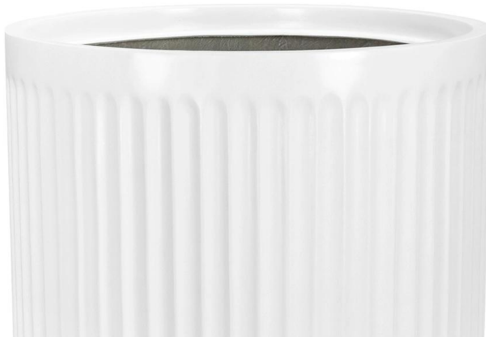
Ryflowana faktura powierzchni doniczki LEO37 w kolorze biały mat

Podobnie, jak inne modele donic ZADORA Classic, tak i doniczki LEO wykonane są z laminatu włókna szklanego i żywicy poliestrowej . To materiał kompozytowy powszechnie znany z lekkości i wytrzymałości, który wykorzystywany jest do produkcji kadłubów jachtów. Powierzchnia donicy malowana jest natryskowo wysokiej jakości farbą poliuretanową w białym kolorze o satynowym wykończeniu . Zastosowane materiały gwarantują odporność na warunki atmosferyczne, trwałość oraz niewielką wagę donicy.