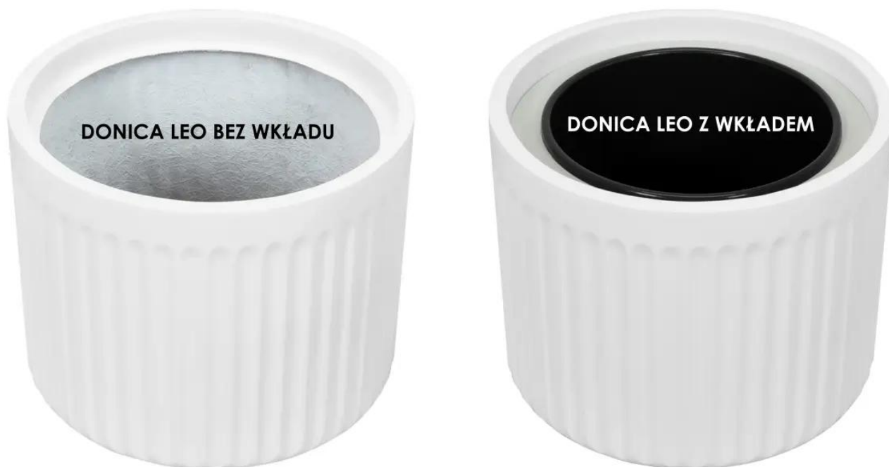
Donica LEO bez wkładu | Donica LEO z wkładem

Dwie opcje donic LEO37: bez wewnętrznego wkładu i z wyjmowanym wkładem o pojemności 13 litrów, to komfortowe rozwiązanie na każdą okoliczność. Nie ma znaczenia, czy chcesz wykonać zieloną dekorację w domu, czy biurze, a może na tarasie lub balkonie, donica LEO37 będzie na pewno dobrym wyborem.