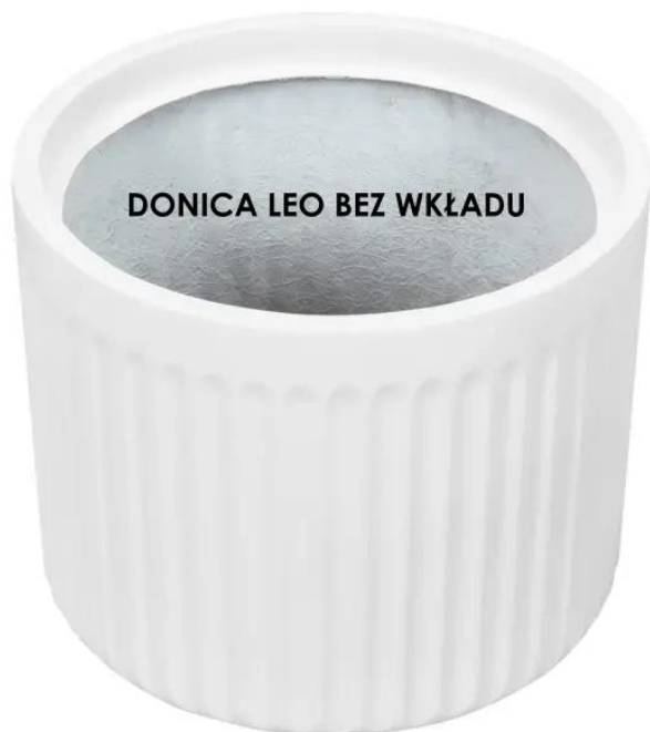
DONICA LEO BEZ WKŁADU

BARTPOL Sp. z o.o. ul. Głogowska 218 60-104 Poznań NIP: 6932050703 t. 61 661 61 78 t. 607 531 181