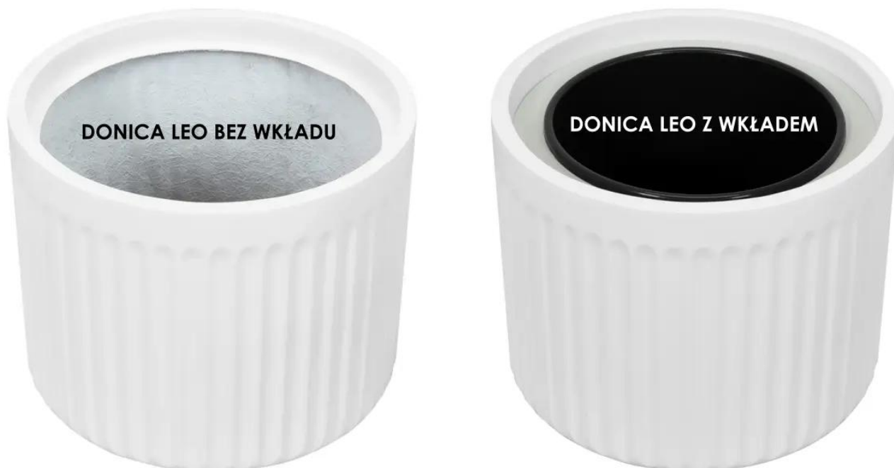
Donica LEO bez wkładu | Donica LEO z wkładem

Donica LEO33 oferuje atrakcyjną możliwość w postaci wewnętrznego wyjmowanego wkładu o pojemności 10 litrów, która wzbogaca jej funkcjonalność i ułatwia pielęgnację roślin. Ta opcja pozwala na wygodną i elastyczną wymianę roślin, dzięki czemu można łatwo odmieniać aranżacje wewnątrz i dostosowywać je do naszych preferencji.