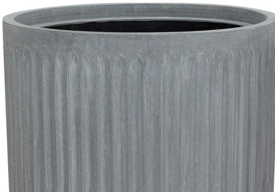
Ryflowana faktura powierzchni doniczki LEO29 w kolorze szarego betonu

Doniczki LEO charakteryzuje żłobiona powierzchnia, która przypomina rzymskie kolumny. Połączenie koloru szarego betonu i tej unikalnej ryflowanej faktury powierzchni doskonale pasuje do nowoczesnych aranżacji o industrialnym charakterze.