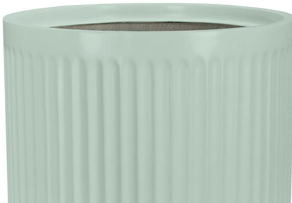
Ryflowana faktura powierzchni doniczki LEO29 w kolorze szalwiowy mat

Pionowe żłobienia ozdobnych boków doniczki LEO przywodzą na myśl majestatyczne rzymskie kolumny. Ta okrągła doniczka LEO29 w matowym szalwiowym odcieniu, z charakterystyczną ryflowaną powierzchnią, doskonale wpisuje się w najnowsze trendy wyposażenia wnętrz oraz tworzenia przestrzeni relaksu.