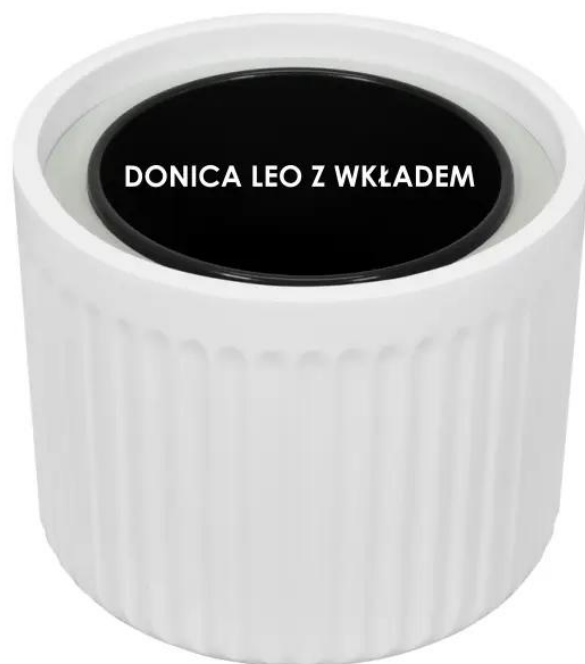
Donica LEO bez wkładu | Donica LEO z wkładem

Wielkość i różnorodność kolorów, w jakich oferowane są doniczki LEO29, pozwalają na tworzenie pięknych, wielopoziomowych kompozycji roślinnych zarówno na tarasie, jak i w pomieszczeniach mieszkalnych czy biurowych. Dzięki temu można stworzyć niepowtarzalny, harmonijny wystrój, który będzie przyciągał uwagę i dodawał uroku każdemu wnętrzu.