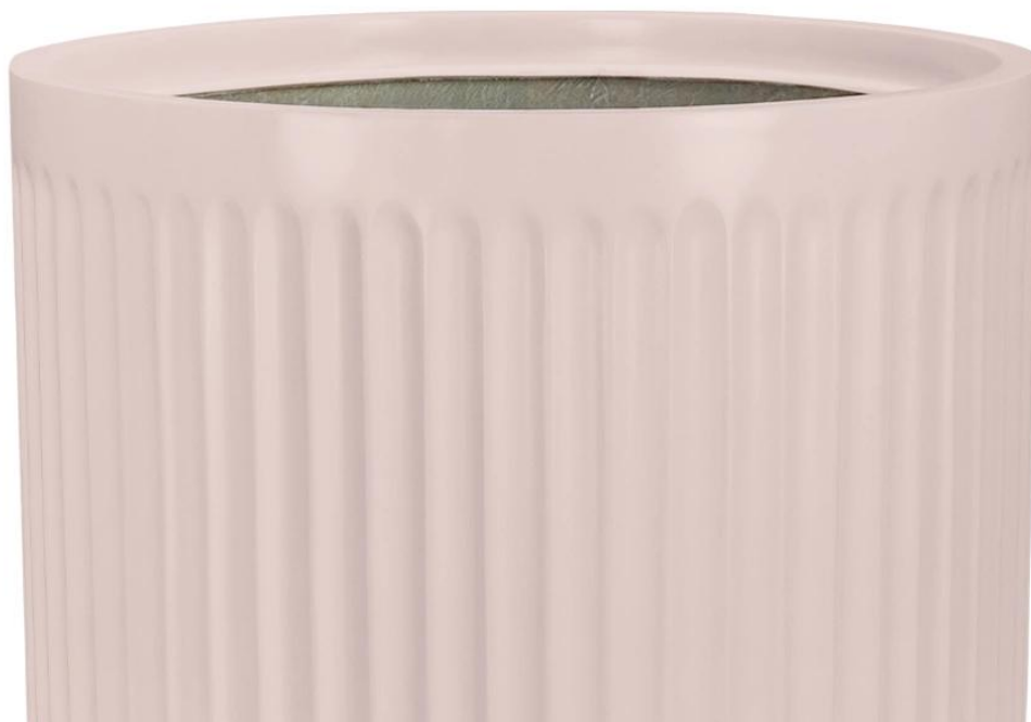
Ryflowana faktura powierzchni doniczki LEO29 w kolorze różowy mat

Pionowe żłobienia na bokach doniczki LEO przywodzą na myśl majestatyczne rzymskie kolumny, nadając jej wyjątkowego uroku. Okrągła doniczka LEO29 w matowym różowym kolorze oraz charakterystycznej ryflowanej powierzchni to wyjątkowym dodatkiem do nowoczesnego wnętrza lub zewnętrznej strefy relaksu. Ta urocza różowa doniczka z pewnością wniesie ożywczą energię do Twojego otoczenia.