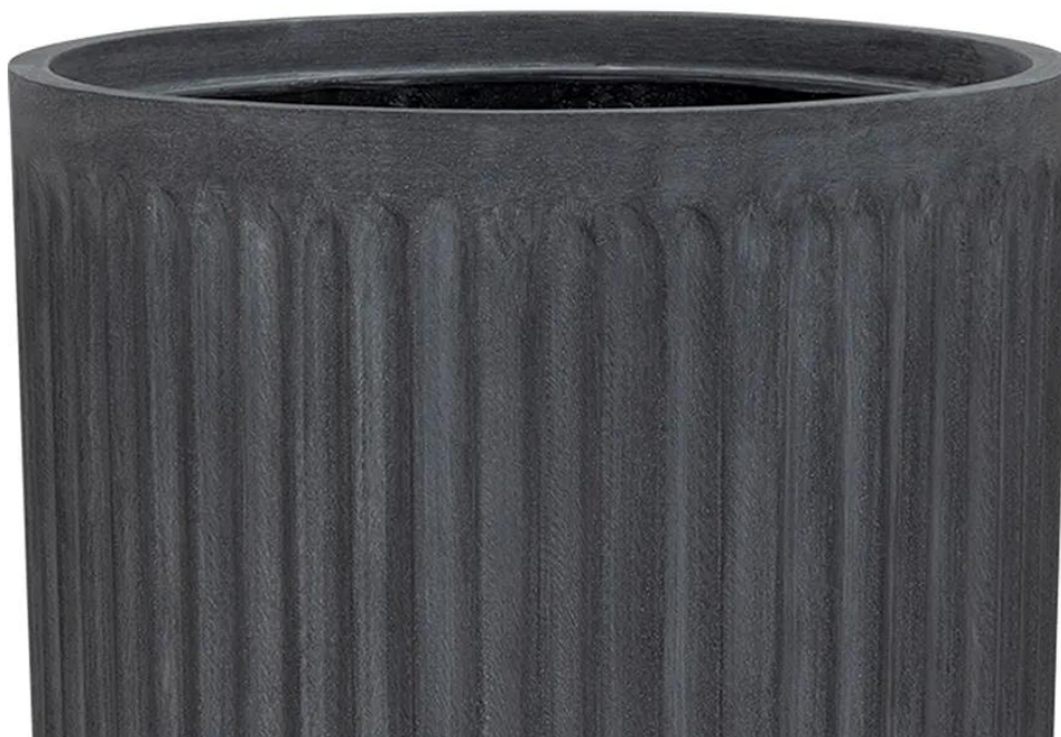
Ryflowana faktura powierzchni doniczki LEO29 w kolorze grafitowego betonu

Doniczki LEO charakteryzuje ryflowana powierzchnia, która przypomina rzymskie kolumny. Połączenie ciemnego grafitowego koloru przypominającego beton architektoniczny i tej unikalnej żłobionej faktury powierzchni doskonale pasuje do nowoczesnych aranżacji o industrialnym charakterze.