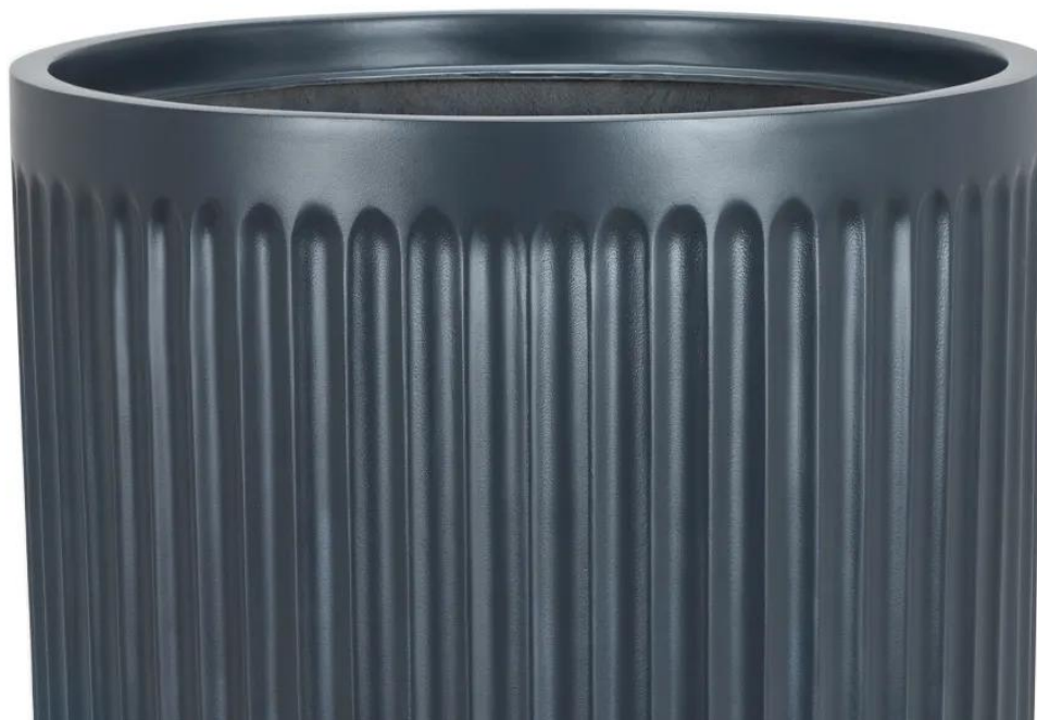
Ryflowana faktura powierzchni doniczki LEO29 w kolorze antracyt mat

Pionowe żłobienia na bokach doniczki LEO przywodzą na myśl rzymskie kolumny. Okrągła doniczka LEO29 w matowym antracytowym kolorze i o charakterystycznej ryflowanej powierzchni doskonale wpisuje się w aktualne trendy wyposażenia wnętrz i urządzenia przestrzeni relaksu.