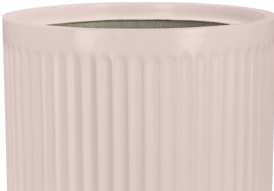
Charakterystyczna ryflowana struktura donicy LEO24 różowy mat

Ta mała różowa doniczka z ryflowanymi bokami z pewnością doda interesującego akcentu Twojemu wnętrzu i stanie się idealnym miejscem dla Twoich roślin. Możesz w niej sadzić rośliny bezpośrednio lub wykorzystać ją jako osłonkę na doniczkę produkcyjną. To praktyczny i designerski wybór dla miłośników piękna i funkcjonalności.