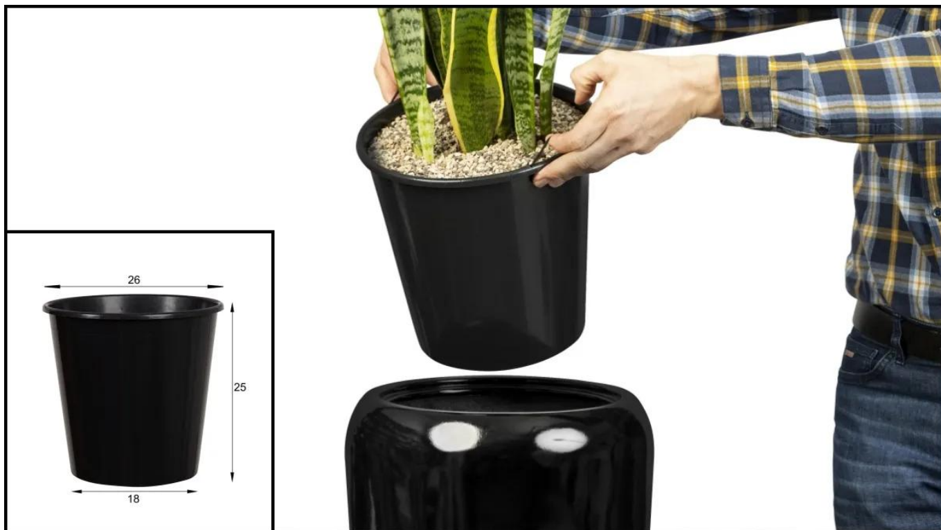
Wymowany wkład donicy D982H

Szarą donicę D982H można wykorzystać bez zastosowania wewnętrznego wkładu. Wówczas mamy do dyspozycji bardzo dużą przestrzeń o objętości około 70 litrów. Donica takiej wielkości pozwala na posadzenie w niej bardzo dużych roślin ozdobnych. Można ją wówczas z powodzeniem zastosować na zewnątrz, gdzie obciążona w całości ziemią będzie wystarczająco stabilna.