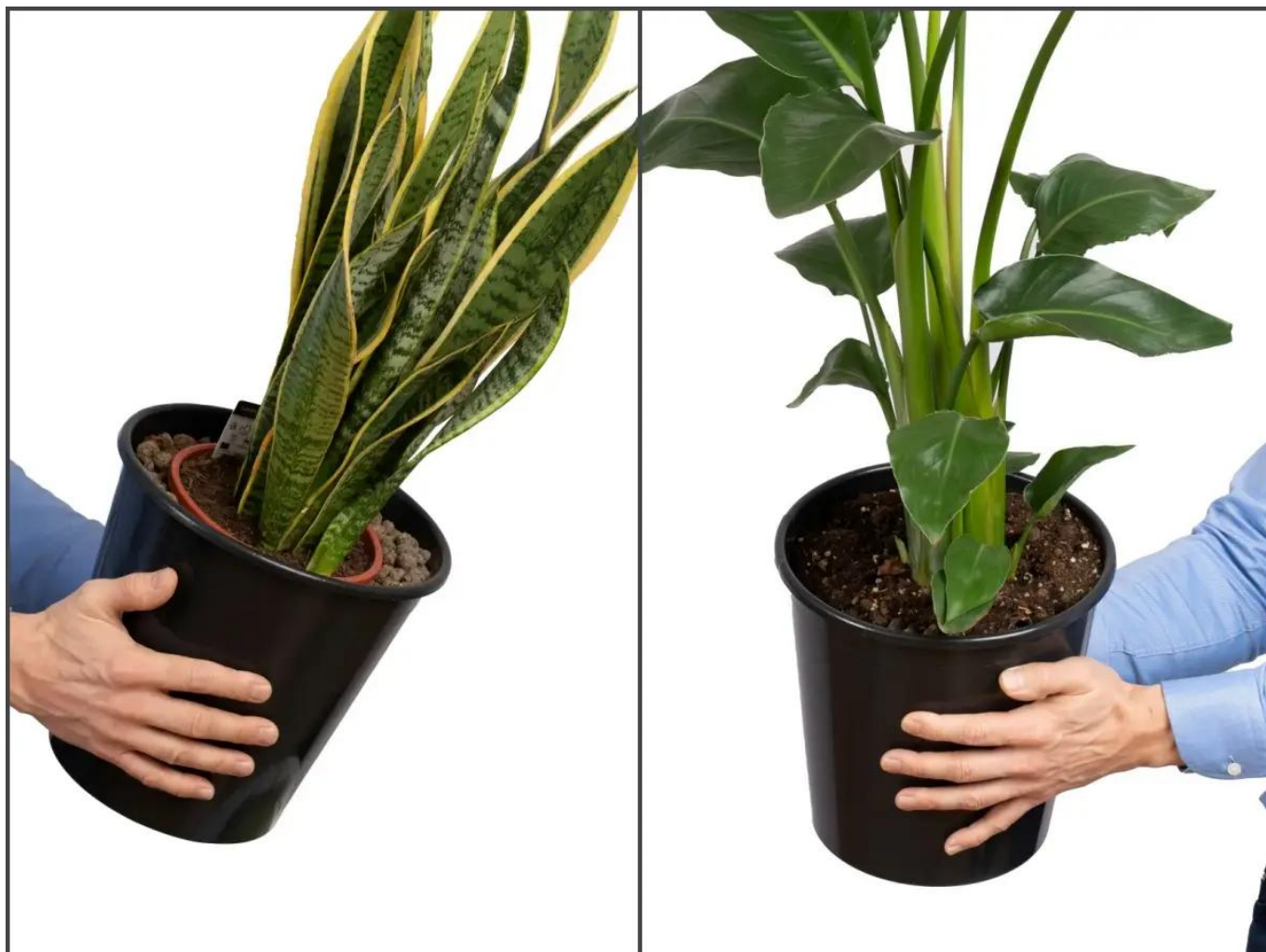
Dwa sposoby wykorzystania wyjmowanego wkładu w donicy D982H

Drugim sposobem jest wykorzystanie wkładu jak doniczki docelowej i przesadzenie do niej zakupionej rośliny. Takie rozwiązanie zapewnia lepsze warunki dla rozwoju rośliny. W zależności od potrzeb możemy wówczas we wkładzie wywiercić otwory odpływowe lub nie. Przy wywierconych otworach nadmiar wody będzie spływał na dno donicy. Jest ona szczelna i woda nie będzie wypływać na podłogę.