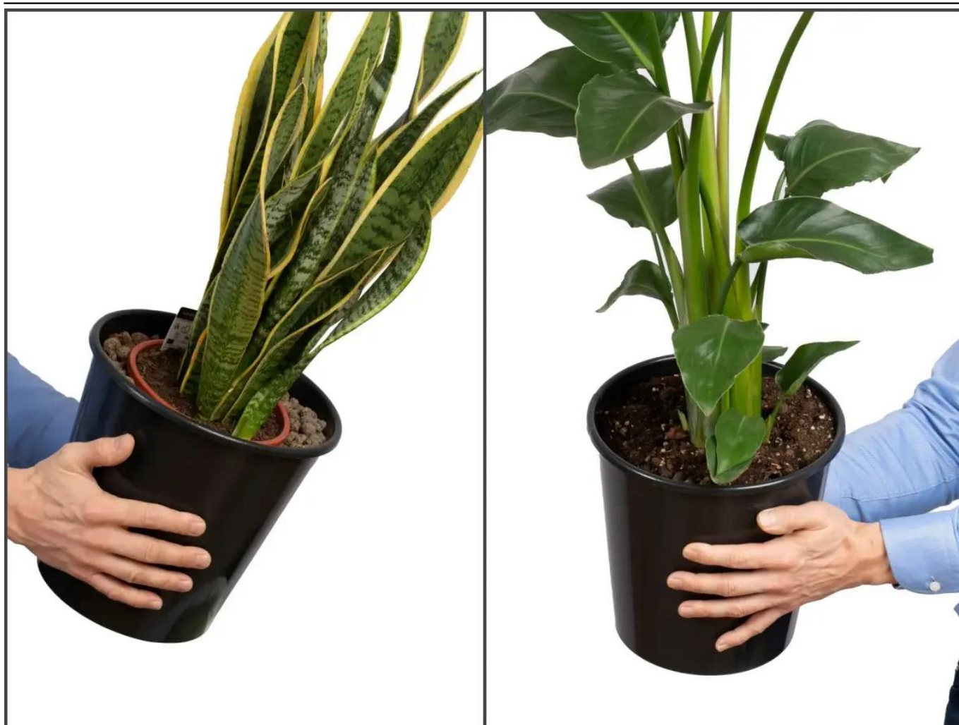
Dwa sposoby wykorzystania wyjmowanego wkładu w donicy D982H

Drugim sposobem jest wykorzystanie wkładu jak doniczki docelowej i przesadzenie do niej zakupionej rośliny. Takie rozwiązanie zapewnia lepsze warunki dla rozwoju rośliny. W zależności od potrzeb możemy wówczas we wkładzie wywiercić otwory odpływowe lub nie. Przy wywierconych otworach nadmiar wody będzie spływał na dno donicy. Jest ona szczelna i woda nie będzie wypływać na podłogę.