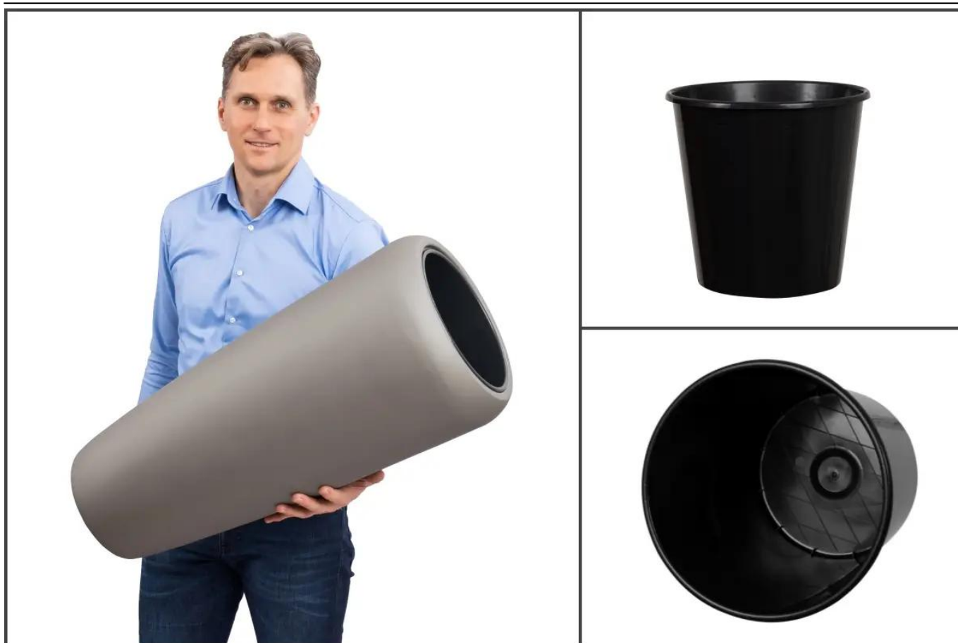
Wymowany wewnętrzny wkład w donicy D982H

BARTPOL Sp. z o.o. ul. Głogowska 218 60-104 Poznań NIP: 6932050703 t. 61 661 61 78 t. 607 531 181