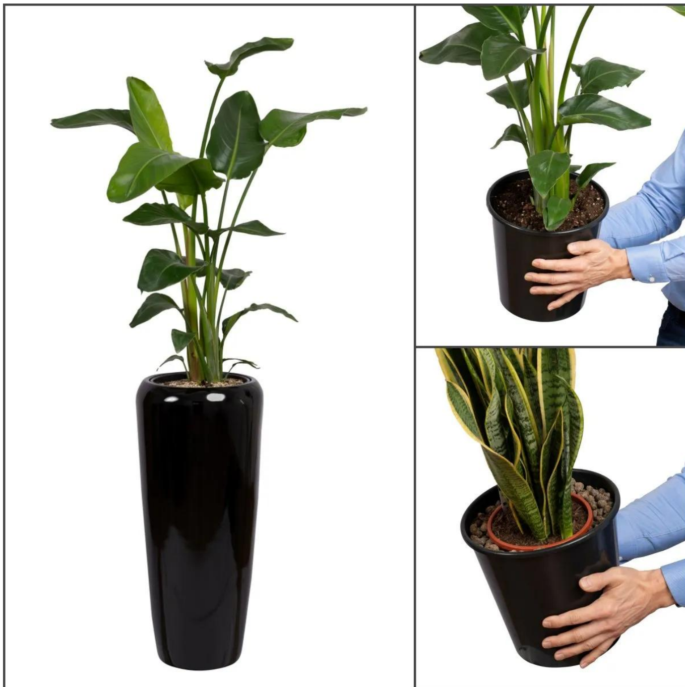
Donica D982B wyposażona jest w wymiowany wewnętrzny wkład o pojemności 10 litrów

Czarną donicę D982B można wykorzystać bez zastosowania wewnętrznego wkładu. Wówczas mamy do dyspozycji bardzo dużą przestrzeń o objętości około 55 litrów. Biała donica takiej wielkości pozwala na posadzenie w niej bardzo dużych roślin ozdobnych. Można ją wówczas z powodzeniem zastosować na zewnątrz, gdzie obciążona w całości ziemią będzie wystarczająco stabilna.