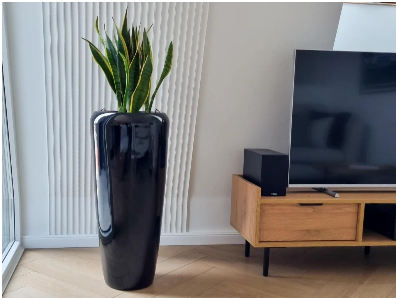
Sansevieria Laurenti w donicy ZADORA Premium D982B czarny połysk

W przypadku zamiaru wykorzystania donicy D982B w na zewnątrz, konieczne jest wykonanie w jej dnie otworów odpływowych, które zapewnią swobodny odpływ wody. Ich wykonanie nie jest trudne, a na życzenie Klienta możemy zrobić je bezpłatnie przed wysyłką donic. Aby zapewnić odpowiednie warunki do rozwoju roślin zalecamy wykonanie w donicy drenażu z keramzytu, zarówno dla donic wykorzystywanych w pomieszczeniach, jak i na zewnątrz.