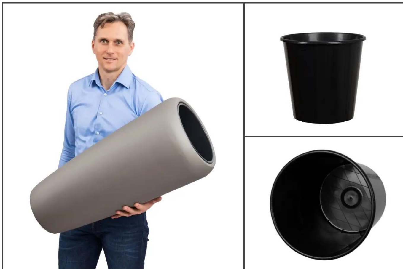
Wymowany wewnętrzny wkład w donicy D982B

Wymowany wewnętrzny wkład polietylenu ma pojemność 10 litrów, 26 cm średnicy i 25 cm wysokości.