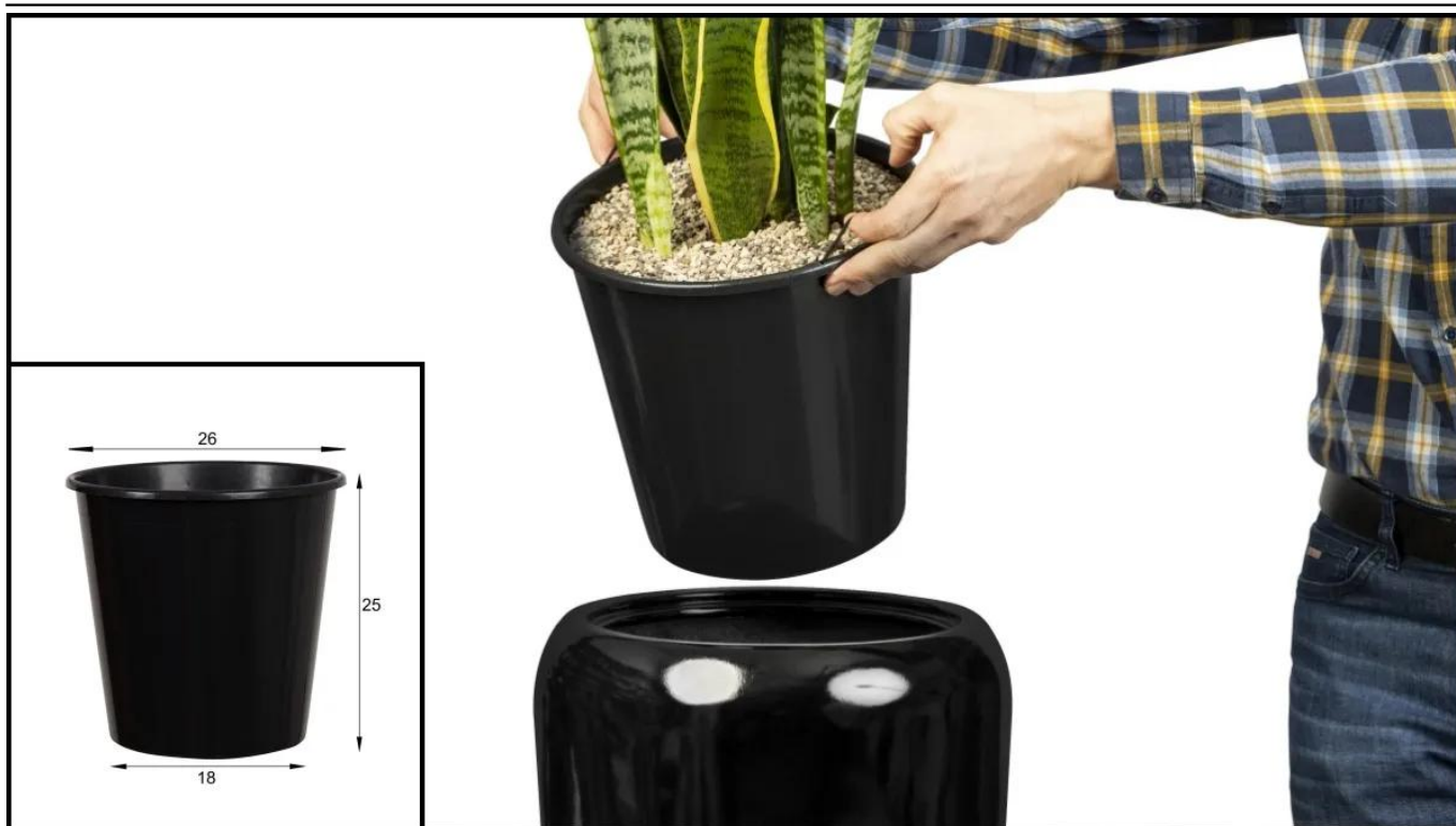
Wymowany wkład donicy D982B.

BARTPOL Sp. z o.o. ul. Głogowska 218 60-104 Poznań NIP: 6932050703 t. 61 661 61 78 t. 607 531 181