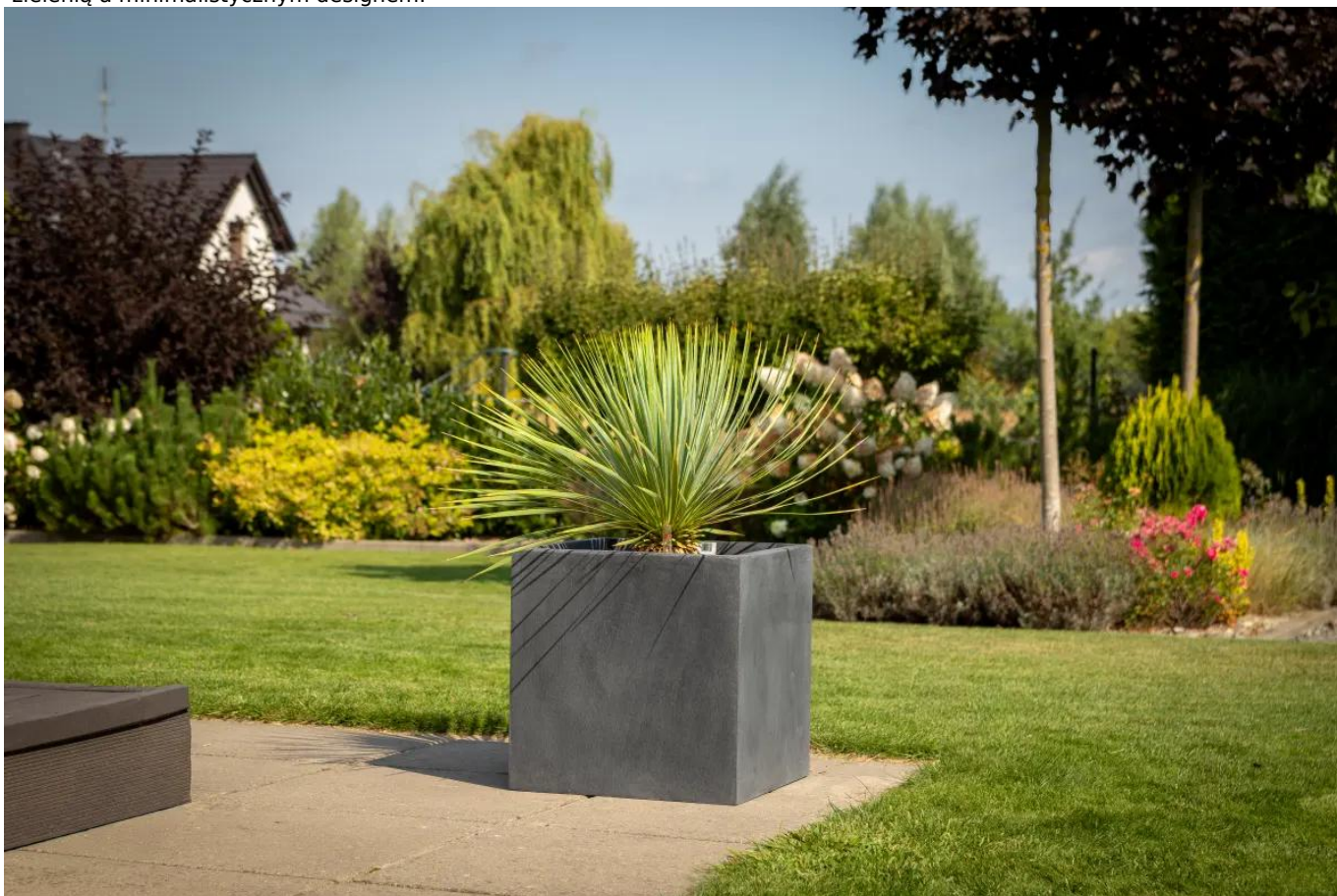
Juka rostrata w donicy ZADORA Classic D92B 38x38x38 cm

Donica ZADORA Classic D92B w kolorze grafitowy beton prezentuje się wyjątkowo efektownie w aranżacji tarasu, obsadzona juką rostrata o architektonicznym pokroju. Surowa estetyka matowej powierzchni, inspirowanej betonem architektonicznym, doskonale współgra z egzotyczną rośliną, podkreślając jej rzeźbiarską formę. Ustawiona w strefie wypoczynkowej staje się wyrazistym akcentem, który nadaje przestrzeni nowoczesny, elegancki charakter i wprowadza atmosferę harmonii między zielenią a minimalistycznym designem.