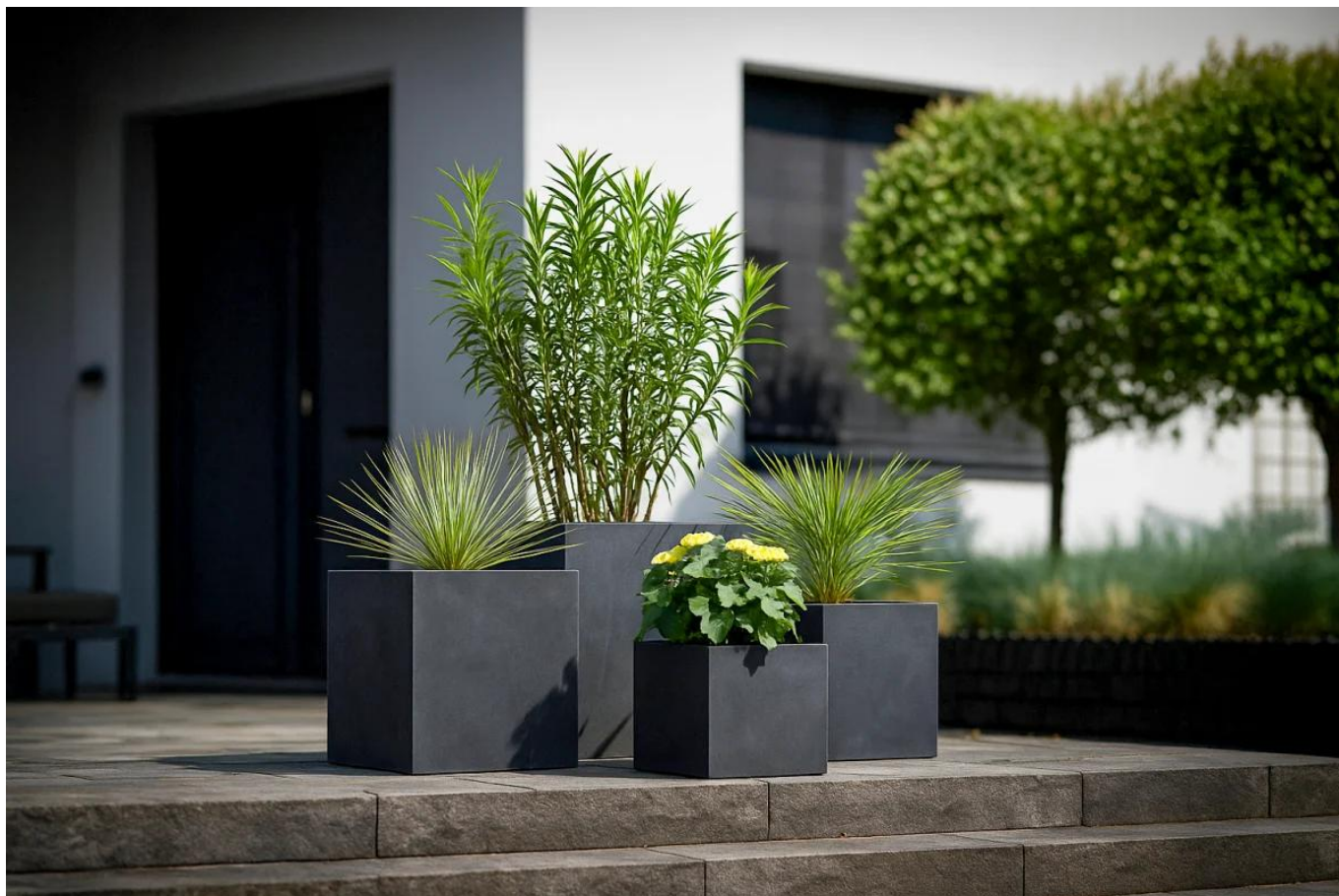
Komplet donic D92A, B, C i D w kolorze grafitowy beton