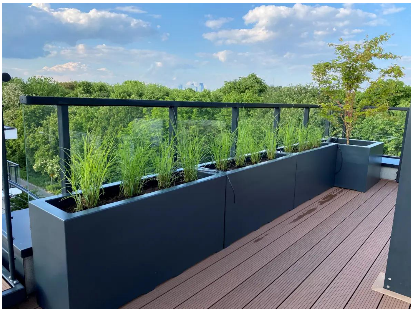
Donice tarasowe D913G 150x50x60 cm antracyt mat na taras

Wielkie donice tarasowe pozwalają na stworzenie na tarasie miejskiej dżungli z różnorodnymi gatunkami roślin w wielu rozmiarach.