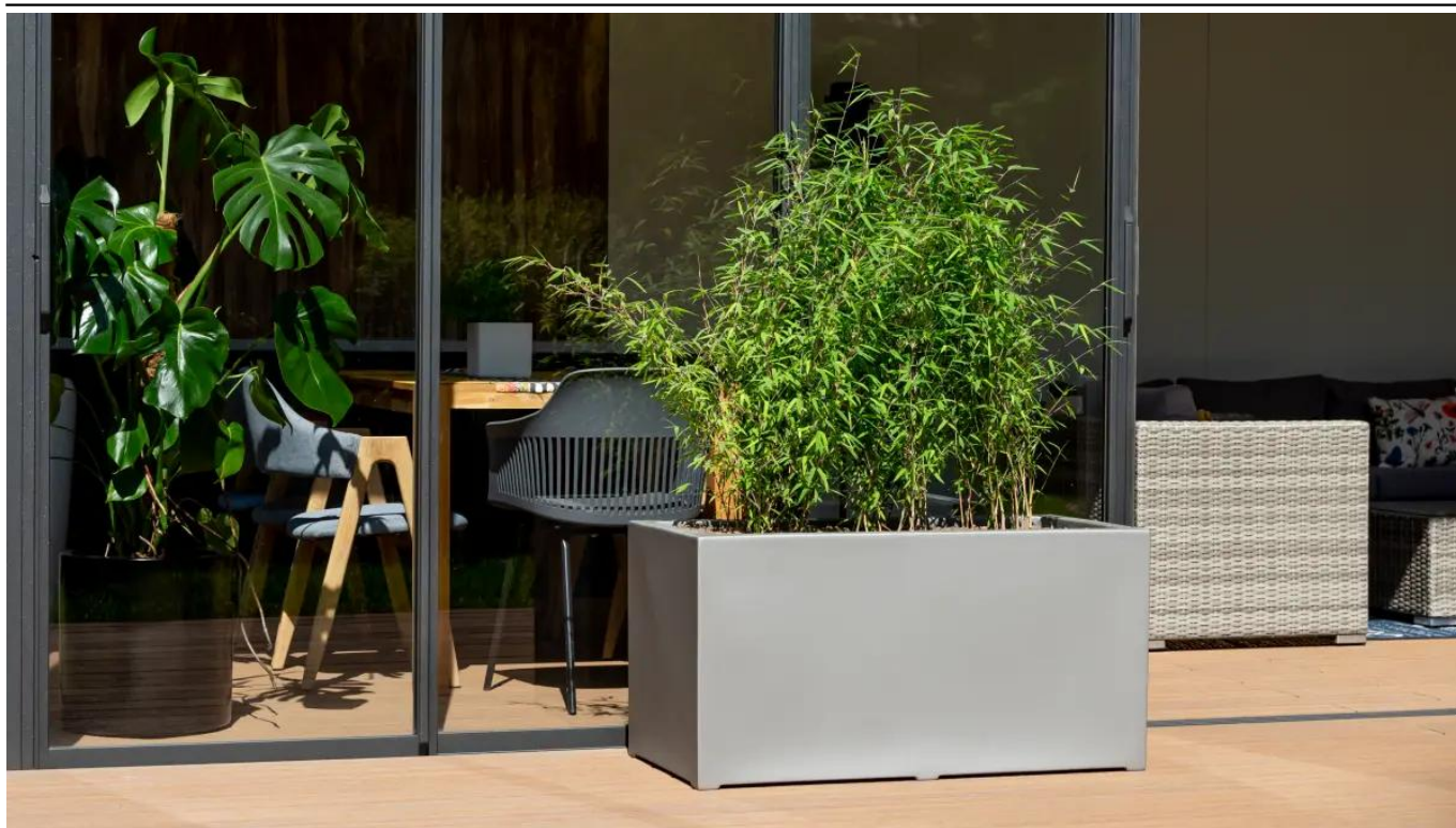
Bambusy w szarej matowej donicy D913C

BARTPOL Sp. z o.o. ul. Głogowska 218 60-104 Poznań NIP: 6932050703 t. 61 661 61 78 t. 607 531 181