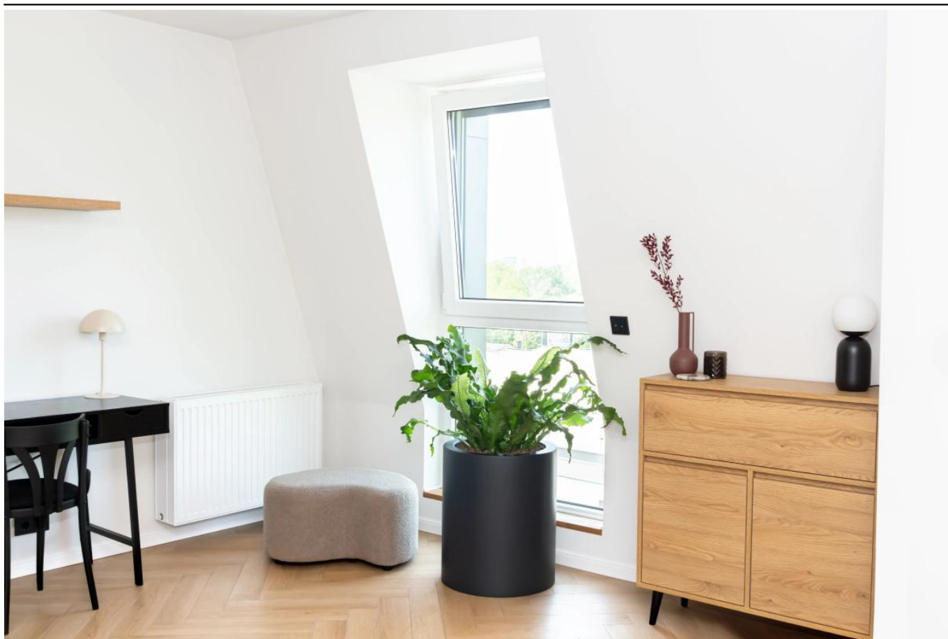
Paproć krokodyla w antracytowej donicy D901N

BARTPOL Sp. z o.o. ul. Strzeszyńska 33 60-479 Poznań NIP: 6932050703 t. 61 661 61 78 t. 607 531 181